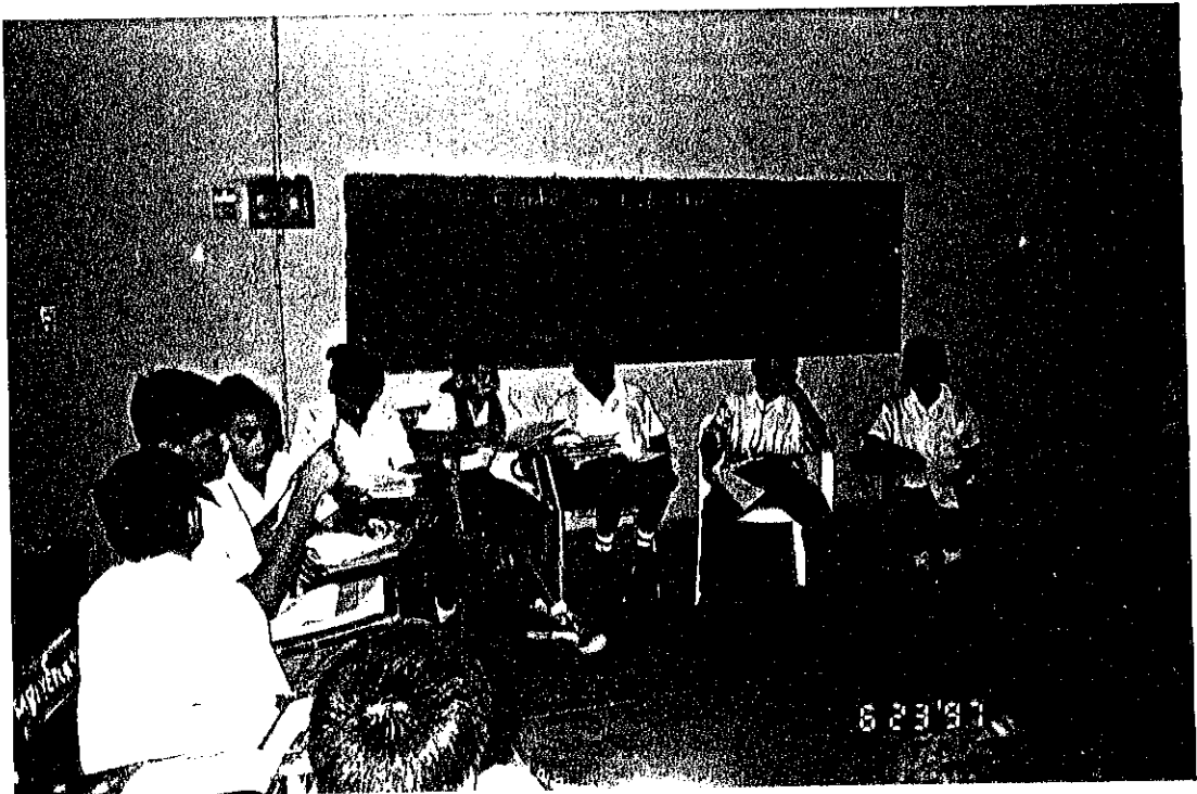
La creatividad de los niños

Les entregue una hoja blanca a cada uno, les pedí que escribieran sobre algo que a ellos les interesaba, para que después lo intercambiaron con un compañero y, después de leerlo le aplicara un título. (Ver anexo no. 1)