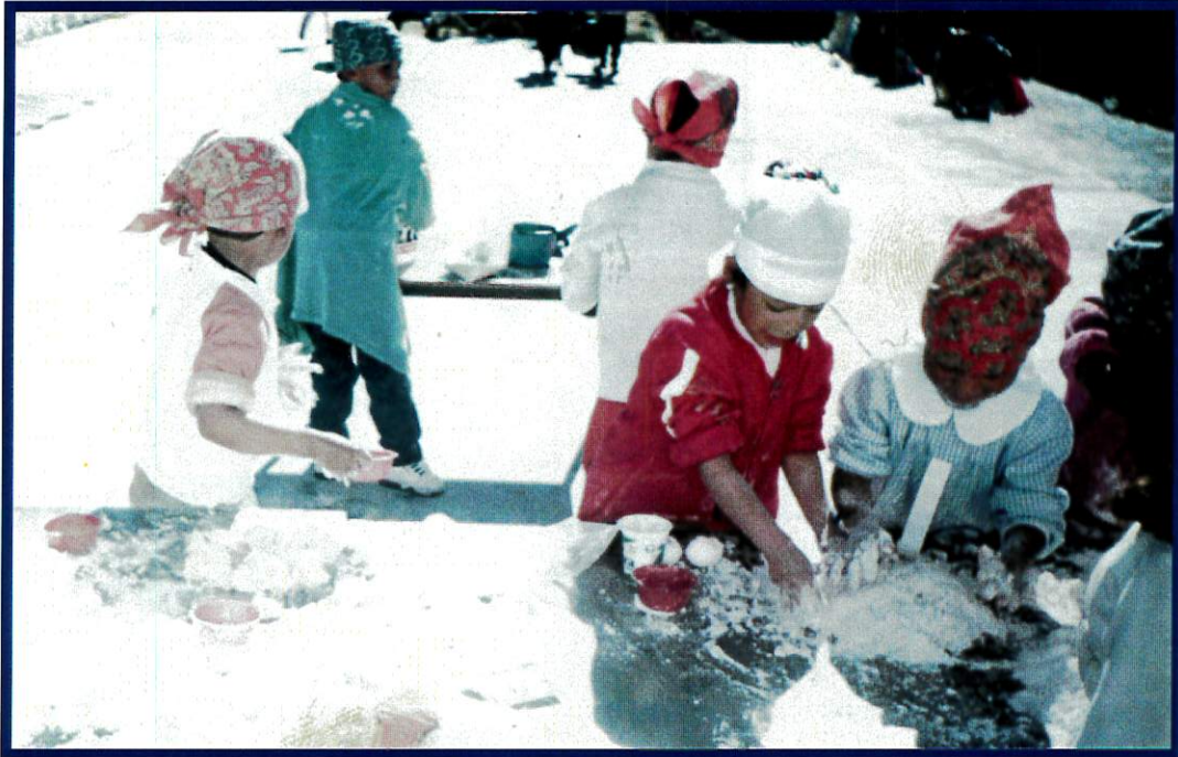
Juego Libre: El Panadero