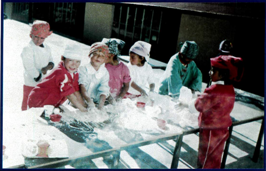
Juego Libre: El Panadero