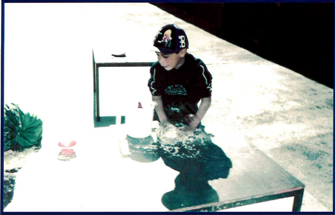
Juego Libre: El Panadero