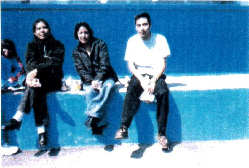
Practicantes normalistas durante el recreo