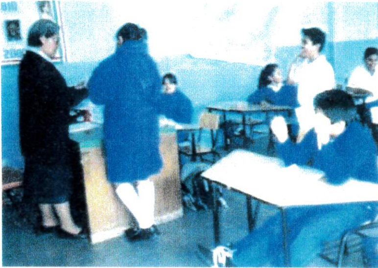
Profesora titular del grupo 6. "A" calificando a los niños.