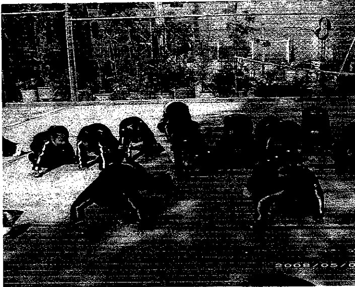
Foto 2. Desplazamiento

En la foto número 2 se puede apreciar como ejercitan el dominio de los músculos del cuerpo; evaluando atención, rapidez de reflejos y orientación al realizar diferentes desplazamientos.