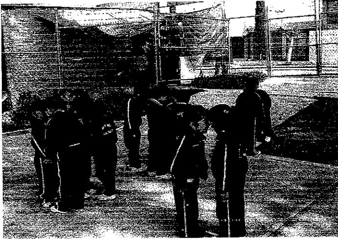
Foto 1. Esquema Corporal

En la foto número 1 se visualiza a los niños identificando y reconociendo su esquema corporal, juntando las diferentes partes de su cuerpo en parejas.