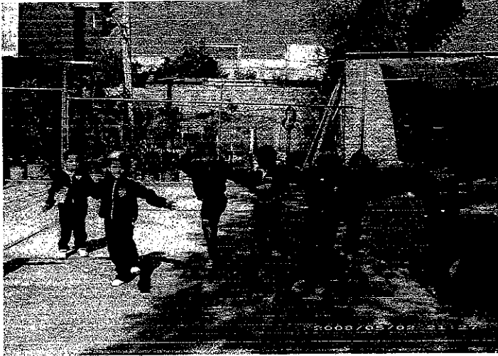
Foto No. 4. Equilibrio

En la foto número 4, se puede observar como se favorece el dominio y control del cuerpo, mostrando su equilibrio al pararse sobre un solo pie y cargar un costal de semilla en la cabeza, posteriormente cambiaban de pie y el costal en otra parte del cuerpo.