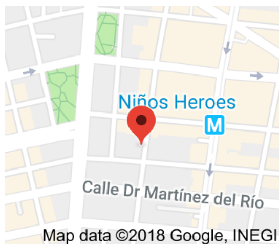
Ilustración 6. Ubicación de la Estancia Infantil “KIKO” 6

La Estancia Infantil “KIKO” se encuentra ubicada en la Alcaldía Cuauhtémoc, Colonia Doctores, en la Calle de Doctor Lucio #171, entre las Calles de Doctor Erazo y Doctor Velasco.