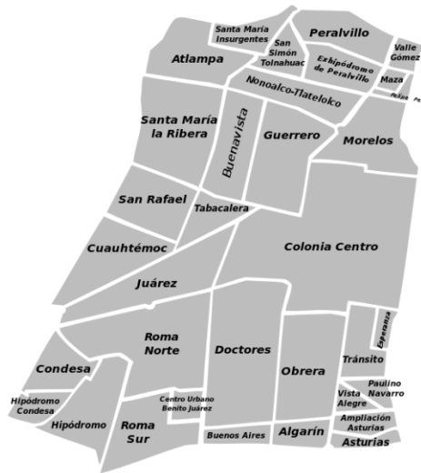
Ilustración 3. División de la Alcaldía Cuauhtémoc 3