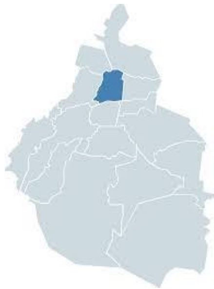
Ilustración 2. Mapa de la Alcaldía Cuauhtémoc 2