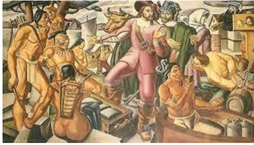
Ilustración 5. Arribo de Hernán Cortés a Tenochtitlan 5