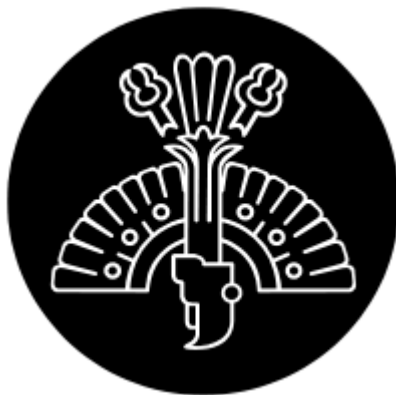
Ilustración 4. Escudo de la Alcaldía Cuauhtémoc 4

En el espacio urbano que ocupa el centro histórico, aún quedan vestigios de nuestros ancestros, que ocuparon la Gran Teocalli, conquistada por los españoles, quienes construyeron sus edificaciones virreinales, sobre los escombros de la Ciudad vencida que sirvieron de la base para construir el Palacio Nacional, la Catedral Metropolitana y el Antiguo Ayuntamiento, hoy considerados como El Patrimonio de la Humanidad.