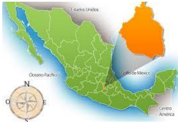
Ilustración 1. Mapa de la República Mexicana Ubicando a la CDMX 1