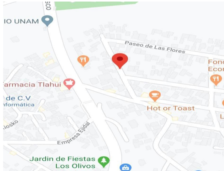
Mapa satelital de la ubicación

La Estancia Infantil De los Ángeles donde me encuentro laborando se ubica en la calle paseo Tulipán, en manzana 1 y lote 63, Colonia Primavera, C.P 14270 en la delegación Tlalpan, en la Ciudad de México, entre las calles de paseo Margaritas y las Flores.