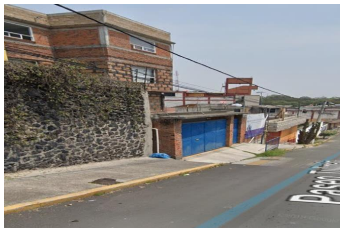
Estancia infantil de los Ángeles