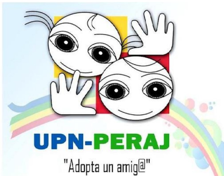
Fig. 5 Logo UPN-Peraj

Para conseguir que los binomios funcionen, se buscan tutores con gustos, metas y objetivos similares a los de su amig@, con el fin de apoyar el desarrollo del menor.