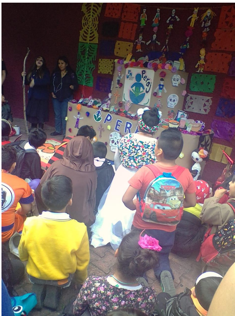
Fig.9 Foto de los amigos en la ofrenda de Dia de Muertos UPN-Peraj 2019.

éramos pequeños y salimos a pedir dulces, nos hizo sentir niños de nuevo. A las actividades realizadas ese día se les sumó una coreografía que se bailó en la explanada de la universidad de dos de las canciones de la película de Coco, que se realizó un par de sesiones después.