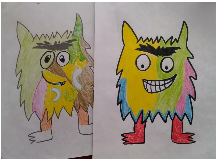
Fig.11 Actividad del área emocional: Dibujos realizados en base al libro "El monstruo de los colores";2020.