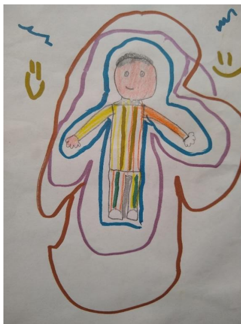
Fig.10 Dibujo realizado por mi amigo, 2020.