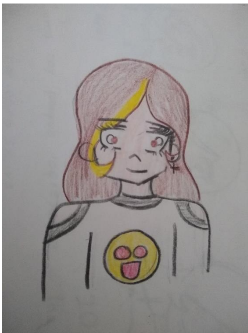
Fig.8 Dibujo realizado por mi amiga en la primera sesión de mentoría, 2019.

expresar más mis pensamientos y sentimientos, ya que las dos éramos similares en algunas cosas, fueron lindos los momentos que estuvimos juntas y aprendí algunas cosas sobre mí, esto me ayudó para seguir con mi trabajo de mentora con otro amigo.