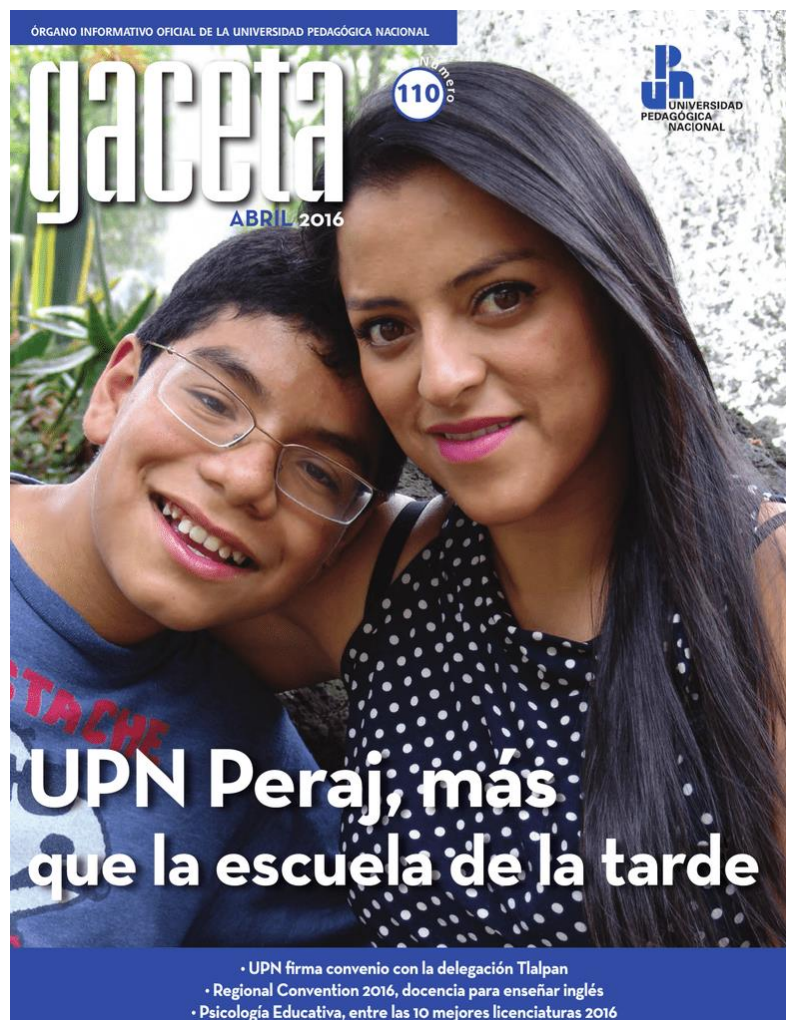
Fig.6 Portada de la Gaceta de la UPN N° 110, abril 2016

Dentro del programa en la UPN se trabaja con niños desde los 8 años hasta los 12 años aproximadamente, la mayoría de ellos son de quinto y sexto año de primaria como lo marca los lineamientos del programa, sin embargo, en la UPN se trabaja con niños más pequeños, beneficiando a niños desde tercer grado de primaria.