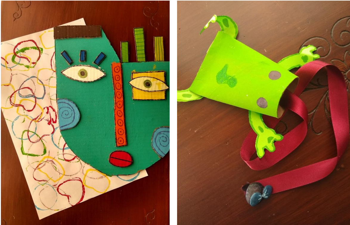
Fig. 14 Ejemplo de manualidades de reciclaje realizadas durante las sesiones en línea,2020.

Fue durante las últimas sesiones del mes de junio donde empezó la etapa de despedida, comenzar a explicarle a los amigos que el programa estaba por concluir, en mi caso le tuve que explicar a mi amigo que él podía volver a Peraj el siguiente ciclo pero que yo ya no iba a ser su mentora, pero que iba conocer a un mentor o mentora que le iba a ayudar al igual que yo lo hice; me hubiera encantado que el me dijera que iba a pensar en volver el próximo ciclo al programa pero en ese momento él no se veía muy convencido de hacerlo, sumado eso no quería hacer las actividades como el birrete o las cartas, hablar con el ayudo que al final hiciéramos las actividades y que se sintiera más tranquilo.