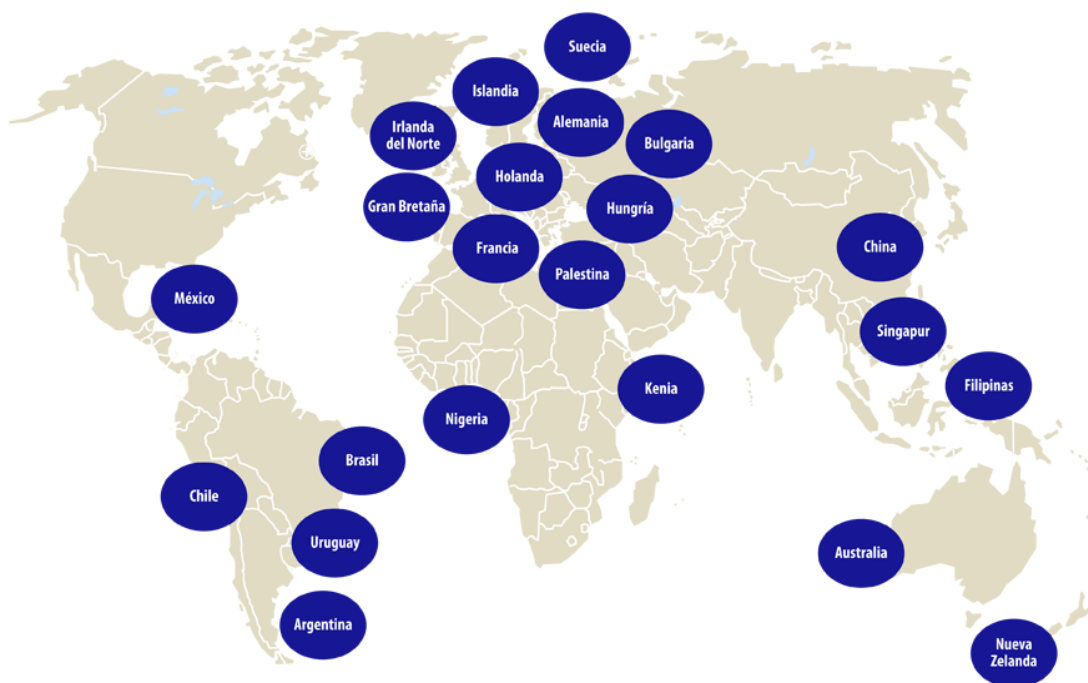
Fig.1 Mapa de distribución de Peraj alrededor del mundo.

El Proyecto Peraj (palabra en hebreo cuyo significado es Flor) nace en Israel en el año 1974. Es iniciado por un pequeño grupo de científicos y estudiantes del Instituto Weizman de Ciencias como un proyecto experimental de acompañamiento de estudiantes de educación superior a niños y jóvenes que requieren de apoyo educativo y emocional, y que residan en comunidades en vías de desarrollo o marginadas. Con el pasar de los años el proyecto fue creciendo, desarrollándose y agregando más áreas de actividad. En la actualidad, en Israel es un proyecto nacional en el que participa alrededor del 20% de los estudiantes de licenciatura del país con más de 30 000 mentores anualmente. La filosofía que orienta Peraj busca proveer un marco informal y personal que permita una interacción directa entre el tutor y el niño, el primero actuando como si fuese un “hermano mayor y modelo positivo” para que el segundo se pueda identificar con él.