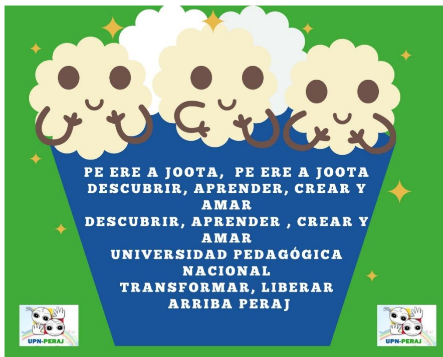
Fig. 12 Porra UPN-Peraj, compuesta por un mentor de la generación 2019-2020.

Por desgracia días antes de que se llevará a cabo el día Peraj se estableció en nuestro país la cuarentena a causa del COVID-19; la universidad al igual que todas las escuelas cerraron sus puertas indefinidamente, pero esta situación no impidió que el programa siguiera con su labor; se cambió la forma de una mentoría presencial o una mentoría en línea.