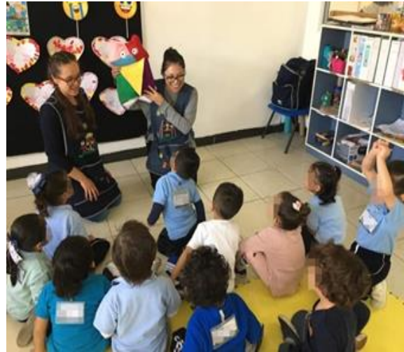
Ilustración 11. El monstruo de colores con primer grado de preescolar (B)