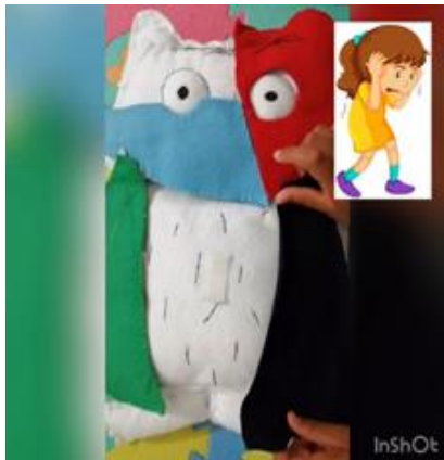
Ilustración 25. Adaptación del cuento "El monstruo de colores"