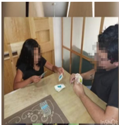
Ilustración 23. Herramientas para conocer y afianzar lazos afectivos con los hijos