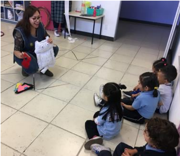
Ilustración 10. El monstruo de colores con primer grado de preescolar (A)