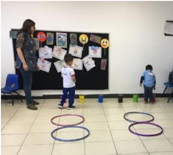
Ilustración 12. Jugando con las emociones en primer grado de preescolar