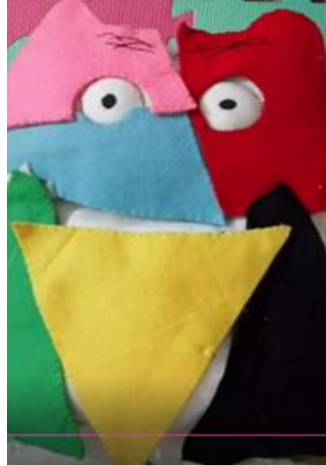
Ilustración 4. Muñeco del cuento "El monstruo de colores" con colores