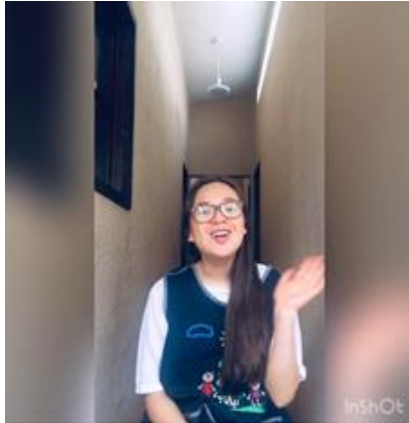
Ilustración 21. Técnicas de respiración (sentados)