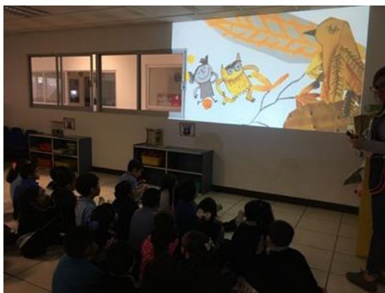
Ilustración 1. Lectura y proyección del cuento con segundo y tercer grado de preescolar.

La actividad consistió en realizar la lectura del cuento “El monstruo de colores”, el objetivo fue que los alumnos identificaran las emociones. La sesión comenzó solicitando a los alumnos que se sentaran en el suelo, frente a la proyección del cuento, posteriormente se inició la lectura y para finalizar se realizó una reflexión grupal sobre el significado del cuento mediante preguntas reflexivas como: ¿De qué trató el cuento?, ¿Por qué el monstruo se sintió así?, ¿Cómo te sentirías en esa situación?, ¿Cuáles son las emociones que se mencionaron?, ¿Te gustó el cuento? (Revisar anexo 6).