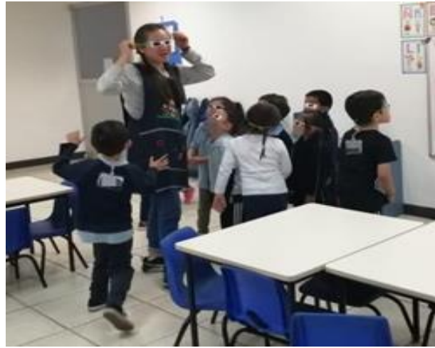
Ilustración 15. Lentes mágicos en tercer grado de preescolar