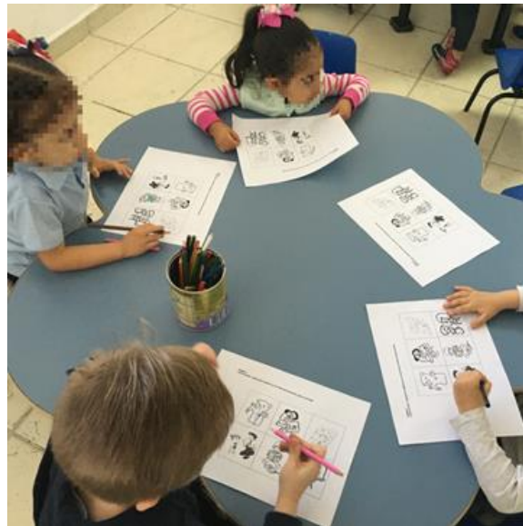
Ilustración 13. Situaciones hipotéticas con primer grado de preescolar

Con los grupos de segundo y tercero de preescolar se realizó una actividad para reconocer sus propias emociones y las de los demás, la cual tuvo una duración de 30 minutos.