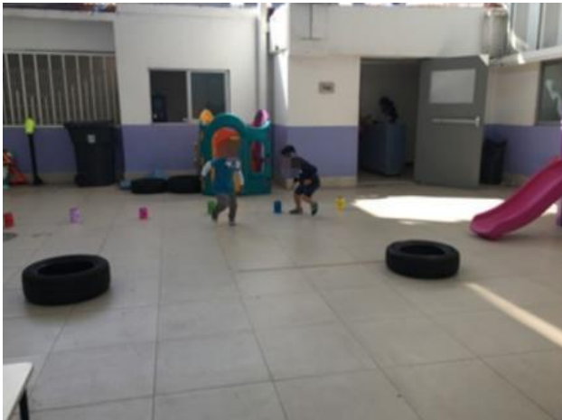
Ilustración 6. Jugando con las emociones en segundo y tercer grado de preescolar