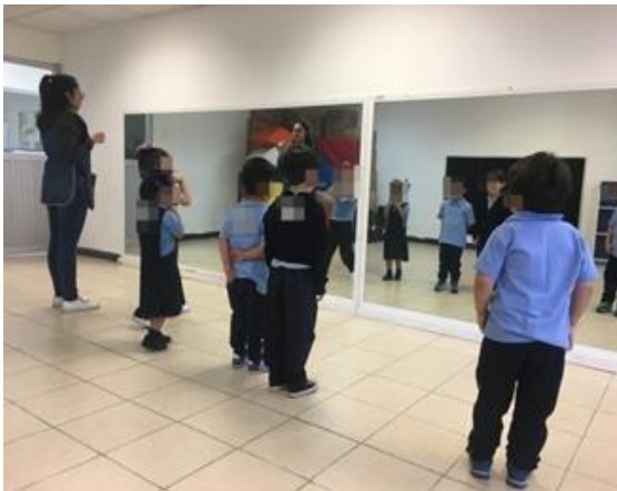
Ilustración 18. Reconociendo virtudes en segundo grado de preescolar

expresión, se realizó una actividad que consistió en mirarse en el espejo, para la cual se les solicitó a los alumnos que hicieran equipos de 5 integrantes y se dirigieran al salón de usos múltiples, ya que este cuenta con un espejo en toda la pared. Para continuar con la actividad, se les solicitó que se vieran al espejo detalladamente, transcurrido algunos segundos se realizaron preguntas como las siguientes: ¿Qué te gusta de ti?, ¿Para qué eres bueno? Para dar cierre a la actividad se apoyó a los alumnos ayudándolos a identificar para qué eran buenos y reforzando las cualidades y virtudes que ellos mencionaban (Revisar anexo 8).