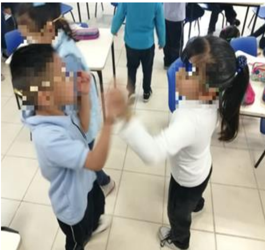
Ilustración 16. Viendo cualidades en los demás