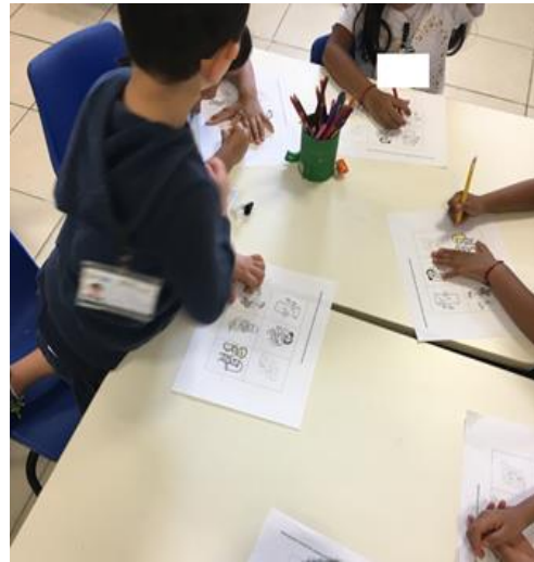
Ilustración 7. Situaciones hipotéticas con segundo y tercer grado de preescolar