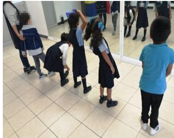
Ilustración 19. Reconociendo virtudes en tercer grado de preescolar