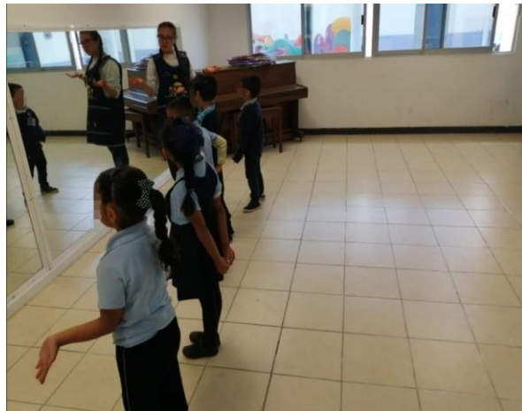
Ilustración 20. Reconociendo virtudes en el salón de usos múltiples

En las semanas posteriores de este mes y en abril no se pudieron llevar a cabo las actividades que se tenían planeadas con anticipación como parte de nuestro programa de intervención con niñas y niños de primero, segundo y tercero de preescolar, las cuales