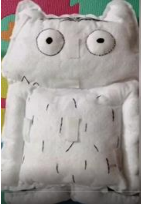
Ilustración 3. Muñeco del cuento "El monstruo de colores" sin colores