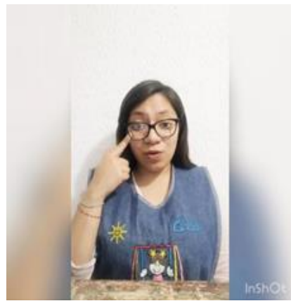
Ilustración 24. Video dirigido a los padres de familia (1)