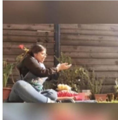
Ilustración 22. Técnicas de respiración (acostados)