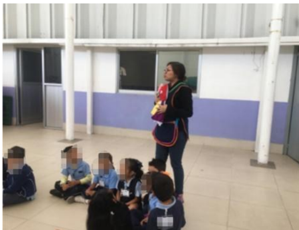
Ilustración 2. El monstruo de colores con segundo y tercer grado de preescolar

La sesión tuvo el objetivo de que las niñas y niños relacionaran las emociones con los colores, para lo cual se utilizó un muñeco del monstruo de colores, al cual se le pueden pegar y despegar partes de colores (ilustración 3 y 4). La actividad se llevó a cabo en el patio del CENDI y comenzó con una serie de preguntas con el fin de recordar la sesión anterior. A todos los alumnos se les colocó un limpiapipas en su muñeca de un color diferente (amarillo, azul, rojo, rosa, verde y negro), para después realizar un círculo y dar a conocer la dinámica, la cual consistió en contar una historia en la que el monstruo era el protagonista de algunas actividades de la vida diaria (despertar, ir a la escuela, desayunar, hacer la tarea); cuando se mencionaba una emoción, el niño que tuviera el color que correspondía a dicha emoción debía pasar al centro del círculo y actuar como si estuviera triste, enojado, feliz, según la situación. Para finalizar, se realizó una reflexión grupal sobre el significado del cuento y la actividad mediante preguntas reflexivas como: ¿De qué trató el cuento?, ¿Por qué el monstruo se sintió así?, ¿Cuáles son las emociones que se mencionaron?, ¿Te gustó el cuento? (Revisar anexo 6).