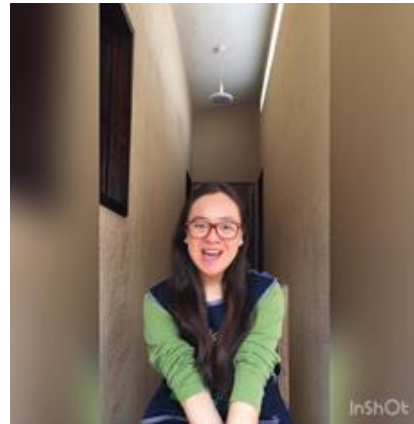
Ilustración 26. Video dirigido a los padres de familia (1)