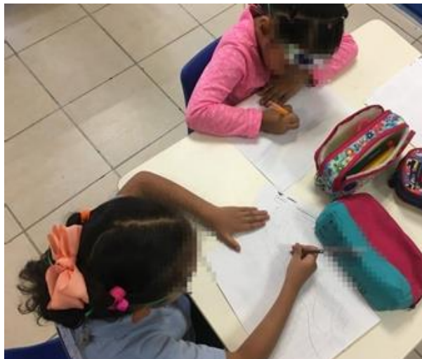
Ilustración 17. Dibujando cualidades y sentimientos