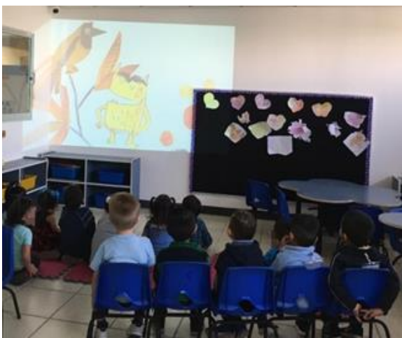
Ilustración 8. Lectura y proyección del cuento en primer grado de preescolar (A)

La actividad comenzó solicitando a los alumnos que se sentaran en el suelo o en las sillas frente a la proyección del cuento para dar lectura al cuento “El monstruo de colores”, el objetivo fue que los alumnos identificaran las emociones, para finalizar se realizó una reflexión grupal sobre el significado del cuento mediante preguntas reflexivas como: ¿De qué trató el cuento?, ¿Por qué el monstruo se sintió así?, ¿Cómo te sentirías en esa situación?, ¿Cuáles son las emociones que se mencionaron?, ¿Te gustó el cuento? (Revisar anexo 5).