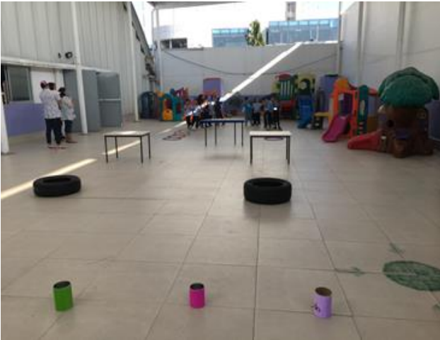
Ilustración 5. Escenario del rally con segundo y tercer grado de preescolar