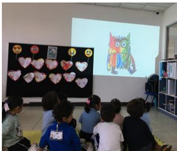
Ilustración 9. Lectura y proyección del cuento en primer grado de preescolar (B)