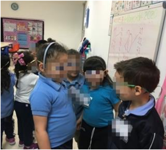
Ilustración 14. Lentes mágicos en segundo grado de preescolar