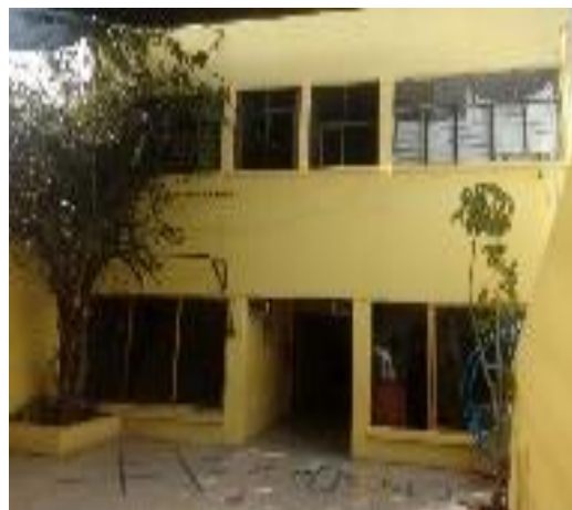
Fotografía 3. Segundo edificio preescolar, dirección, cómputo, biblioteca

La institución cuenta con un grupo de preescolar 2 y uno de preescolar 3, un director y dos docentes, cuyos perfiles son una profesora, una licenciada en educación preescolar, una licenciada en pedagogía y una directora con licenciatura en pedagogía; así mismo, colaboran una profesora de inglés, un profesor de música, un profesor de educación física, una profesora de danza y uno de computación.