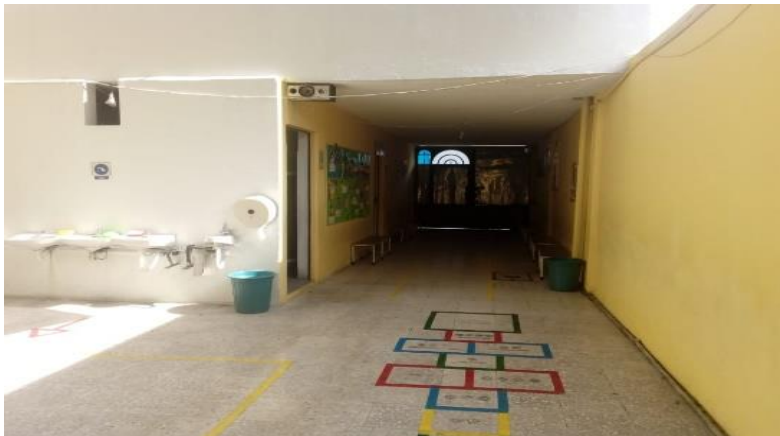
Fotografía 1. Entrada de la escuela.

El Preescolar está a la mitad de la calle del lado izquierdo, físicamente el preescolar está adaptado en un terreno que era una casa de dos plantas, a la cual se le hicieron modificaciones para implementarla como institución educativa, nuestra institución es particular de organización completa, la institución está integrada con primaria y preescolar, las aulas están distribuidas en dos edificios; el de la entrada alberga en la parte baja y alta a grupos de primaria, (fotografía 1) después está el patio (con una longitud de 9 metros de largo por 8 metros de ancho) (fotografía 2) y en el siguiente edificio en la planta baja están preescolar, dirección y dos pequeñas bodegas y en la parte alta está un espacio destinado para biblioteca, audiovisual, un salón de primaria y el salón de cómputo (Fotografía 3).