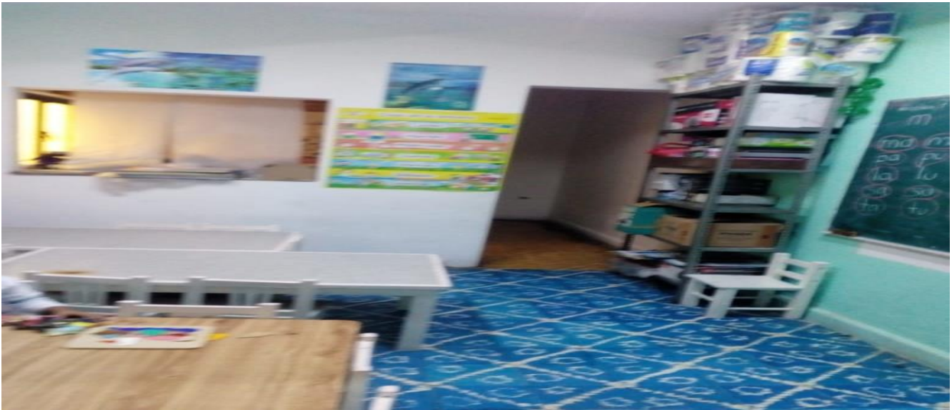
Fotografía 6. Salón de clases. (Ap.)

Mi grupo está conformado por 16 alumnos, de los cuales 8 son niñas y 8 son niños, uno de estos niños tiene Autismo y está en terapia externa.