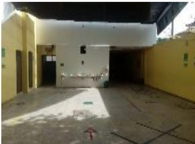
Fotografía 2. Patio de la escuela.