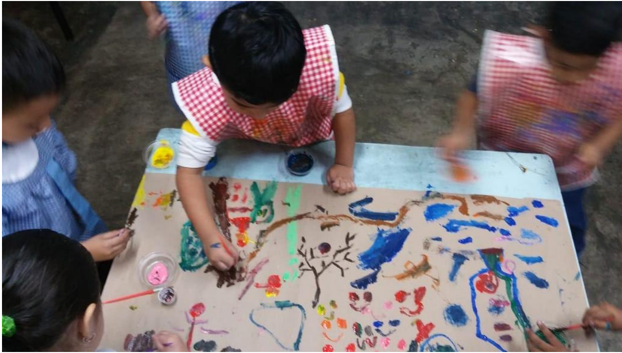
Trabajando con pintura vegetal y lechera Trabajo colaborativo.