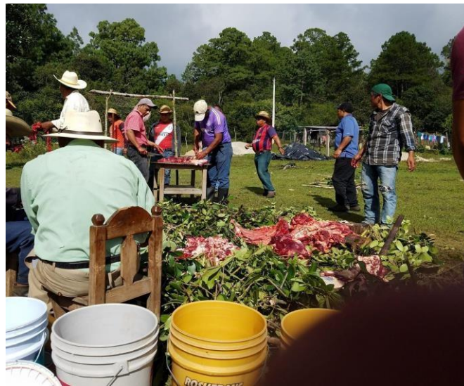
Foto 4. Kojtak'in (Fotografía de un poblador de Lomantán, 5 de noviembre 2020)

Una vez muerto el wacash se comenzaba a repartir el kojtak'in, se distribuye entre las personas que en días anteriores habían apartado su kojtak'in, para respetar su porción de kojtak'in. La persona tiene que estar presente y ayudar durante todo el kojtak'in, aunque también puede enviar a alguien de su familia para representarlo. Al final del día todas las familias se marchan a sus casas. Al día siguiente por la mañana se puede observar cómo en las casas se desprende de las cocinas el humo del fogón, como señal de las ricas comidas que cada familia prepara para sus ofrendas. Cocinar caldo de res, de pancita, tamales, o alguna otra comida que a los muertos de los familiares les gustaba comer.