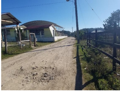
Foto 5. Escuela Bonampak

Los/as niños/as de esta escuela son de familias tojolabales que se dedican a la agricultura y al comercio principalmente. Podemos ver a los niños trabajando con los padres los fines de semana en las milpas o yendo a vender al centro de Las Margaritas. También existen niños/as de padres inmigrantes que migran a los Estados Unidos en busca de mejores oportunidades. Algunas personas se van de “mojado” (ilegal), aunque la mayoría, son hombres que cuentan con pasaporte y papeles para trabajar libremente y cada determinado periodo de tiempo regresan, es decir, son contratados para trabajar fuera.