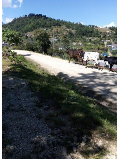
Foto 3. Entrada a Lomantán (fotografía de un poblador de Lomantán, 2018)

Alrededor del camino se pueden ver los hermosos campos donde hombres y mujeres juegan fútbol, y caminan libremente vacas, caballos y ovejas. En muchas de las casas podemos encontrar árboles de cipreses, así como árboles frutales de lima, aguacate, durazno, café, toronja y guayaba, siendo el aguacate y el durazno los productos que las personas de la comunidad venden principalmente en Comitán y Las Margaritas. Los cerros que se pueden ver por todo el rededor de la comunidad son cerros de pinos y robles. En el centro de la comunidad está la iglesia, la casa ejidal y la Escuela Primaria Bilingüe Bonampak.