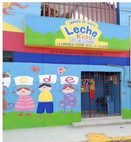
Acceso y fachada de Leche kids preschool

Estas actividades planeadas permiten reforzar algunos temas de los contenidos que llevamos en el programa del jardín de niños Leche Kids, con el propósito de crear un vínculo afectivo escuela, niños padres de familia y maestros.