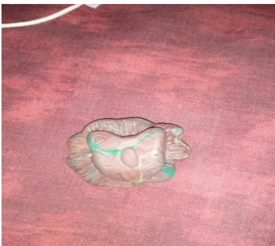
Imagen 3: escultura técnica de masa moldeable