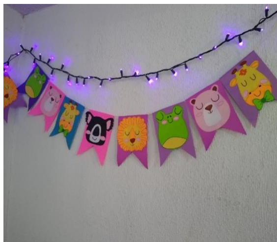
imagen 4: instalación técnica con luz y papel

En el arte teatral se realizó un guion teatral de nuestra autoría o modificado para después realizar la obra de teatro y con base en lo anterior mencionado se realizó