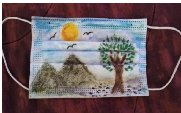
Imagen 2: técnica con acuarelas y tela