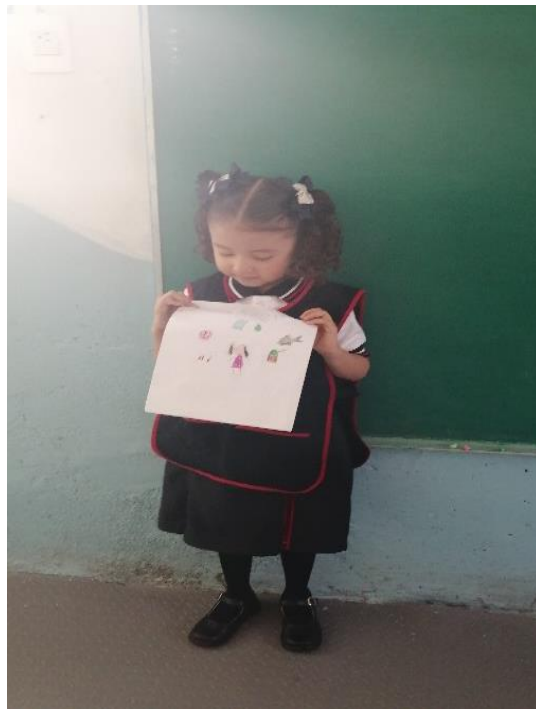
Alumna presentando a sus compañeros el final que inventó