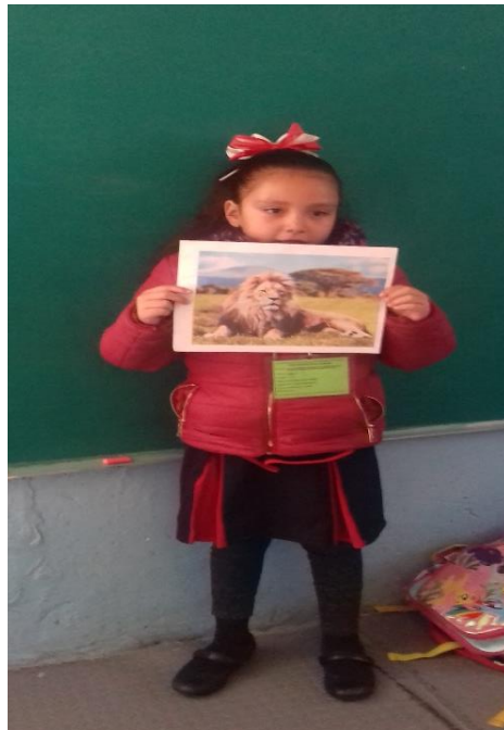
Alumna presentando su tema a sus compañeros