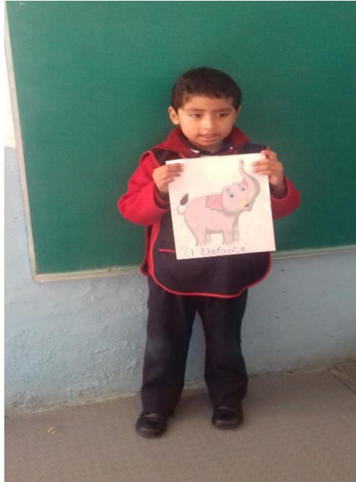
Alumno exponiendo la información de su investigación.