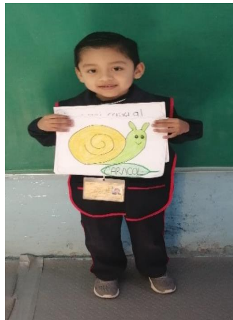
Alumno mostrando al grupo la respuesta de su adivinanza.