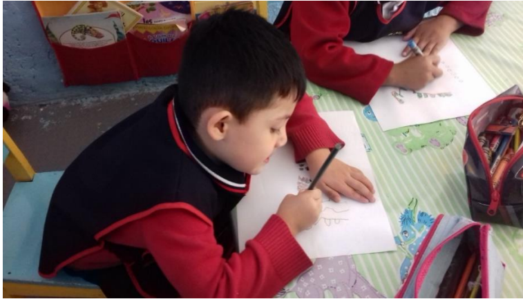
Alumno realizando el dibujo del final de la historia.