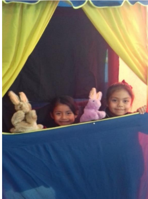
Alumnas presentando a sus compañeros el cuento “Las conejitas”.