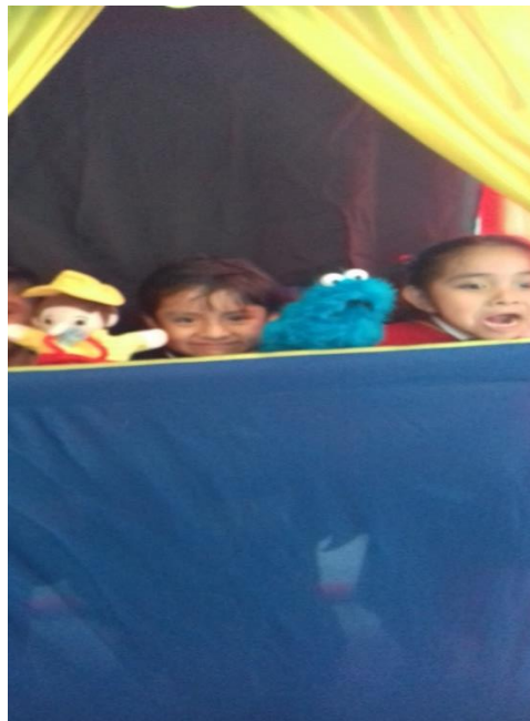
Alumnos terminando la presentación de su historia.