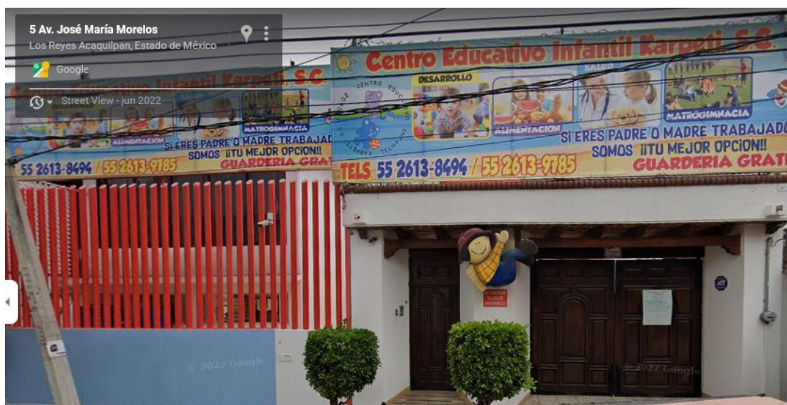
Instalaciones del Centro educativo infantil Karpeti

Está ubicado en una de las principales calles del pueblo de Tecamachalco, donde transitan la mayoría de trabajadores, vecinos y estudiantes, se encuentra a un costado de las principales empresas como Coca Cola FEMSA y grupo papelero Gutiérrez, plaza Hidalgo, primaria publica Adolfo Ruiz Cortines y jardín de niños publico Luis Pasteur, está rodeado de pequeños comercios como, frutas y verduras, tiendas, tortillería y sobre todo cocinas económicas.