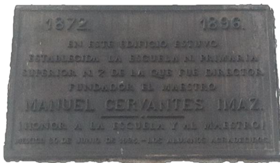
Fuente: Fotografía tomada en la calle San Idelfonso, Col. Centro Histórico