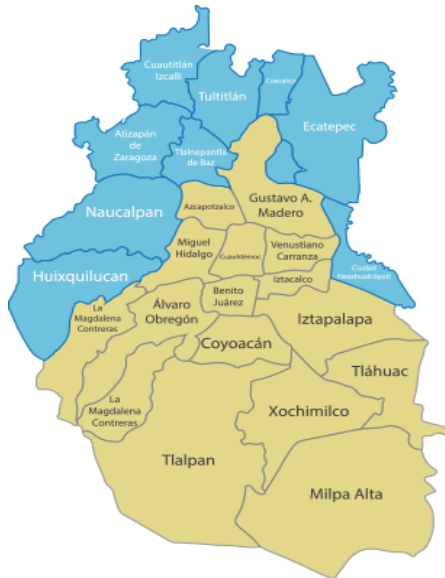
Imagen. - 2 Ciudad de México 2

Entre ellas se encuentra la Alcaldía Gustavo A. Madero, cuenta con una extensión territorial de 91.5 Km 2 . Colinda al sur con las Alcaldías de Azcapotzalco, Cuauhtémoc, al Oeste con Venustiano Carranza, y al norte y noroeste con los Municipios del Estado de México Tlalnepantla y Ecatepec de Morelos, Coacalco de Berriozábal y Tultitlán, cuenta con 10 barrios, 133 Colonias, entre las que se encuentra la Colonia “La Casilda”. 3