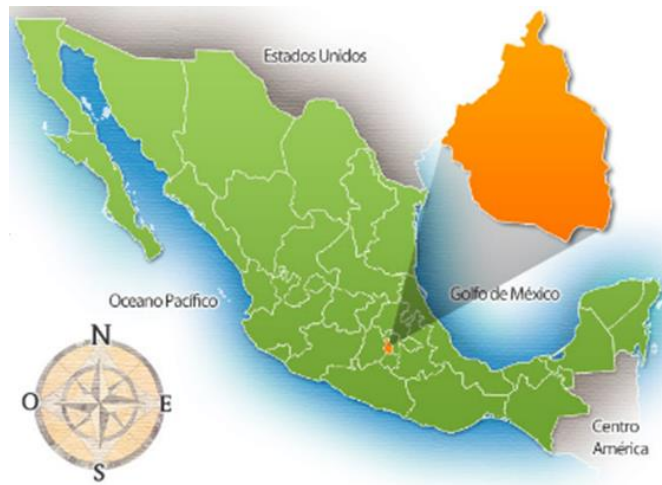
Imagen. - República Mexicana 1

En los Estados Unidos Mexicanos (México), se encuentra La Ciudad de México (CDMX) rodeado de Oriente a Poniente por el Estado de México, y al sur poniente colinda con Morelos. La CDMX se encuentra dividida en 16 Alcaldías (nueva denominación a partir de 2016).