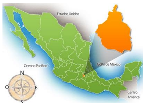
MAPA DE LA CIUDAD DE MÉXICO SEÑALANDO LA ALCALDÍA TLALPAN 2