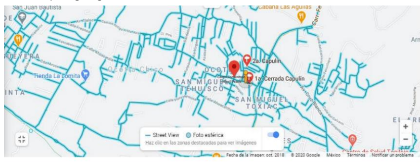
Croquis geográfico de la ubicación del Centro educativo Praxis 20

El Centro Comunitario Infantil (CCI) “Praxis”, se encuentra ubicado en la Ciudad de México, en la Alcaldía Tlalpan, en el Pueblo San Miguel Topilejo, Calle Capulín 25-A, en la Colonia San Miguel Tehuisco.