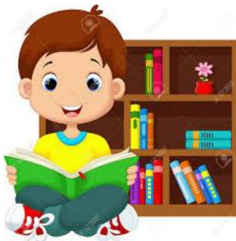
Imagen.- Preescolar y la lectura 60

referentes distintos a los del ámbito familiar; también proporciona a las niñas y los niños oportunidades para tener un vocabulario cada vez más preciso, extenso y rico en significados, y los enfrenta a un mayor número y variedad de interlocutores.