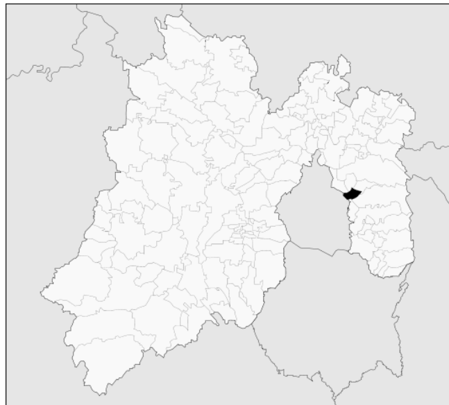
México, Municipio Los