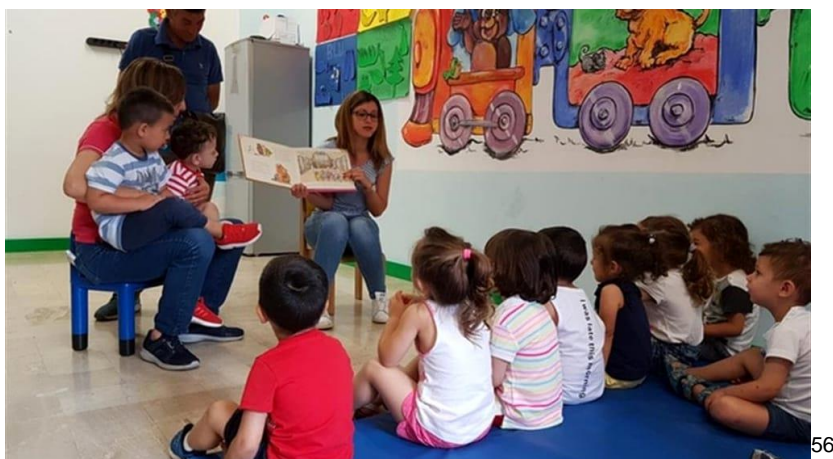
Imagen.- La Lectura en niños de preescolar.

La lectura en Preescolar; Uno de los puntos importantes que resalta la RIEB a Nivel Básico es el hacer un uso innovador de las tecnologías de la información y comunicación que ponen al alcance para que los alumnos se integren a leer y formen este hábito, la RIEB propone que los profesores utilicen audiolibros o plataformas de la SEP que puedan ser escuchados en el aula y no solo dependan de los libros de texto, la RIEB busca que los niños salgan con esta habilidad o competencia que puede ser medida en un grado más alto como lo es pasar a la Educación Básica que sería “la primaria” y con esto mejorar los aprendizajes de los estudiantes. 55