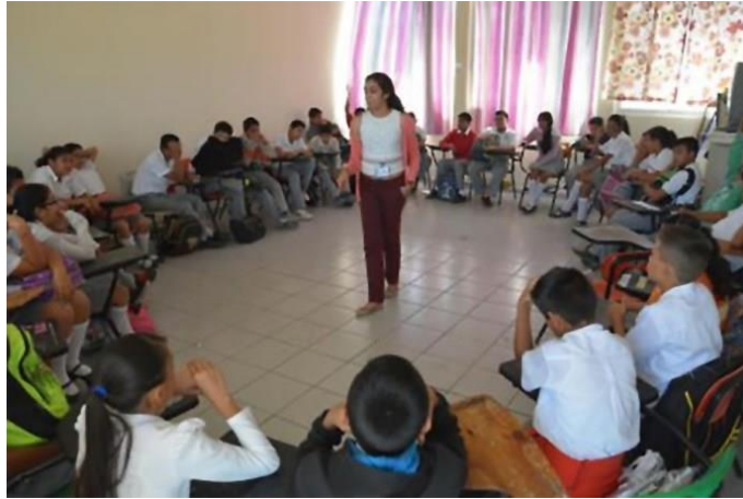
Imagen.- Actividad recreativa 84

Maestras y maestros tienen el saber indispensable para repensar y modelar las estrategias que pondrán en juego en el salón de clase. En este sentido, se espera que, con la experiencia construida, aborde críticamente la planeación en el contexto escolar. Algunos principios organizadores de los contenidos son los siguientes. Recuperar el sentido de la experimentación pedagógica desde un punto de vista lúdico, que lleve a la integración de áreas, campos de conocimiento y asignaturas. Organizar estrategias y actividades de apoyo de los padres de familia en el tratamiento de los contenidos para beneficio de la formación de las y los estudiantes, El trabajo pedagógico cobra sentido al diseñar, construir, seleccionar diversas estrategias metodológicas que contribuyan al aprendizaje de las y los estudiantes. 85