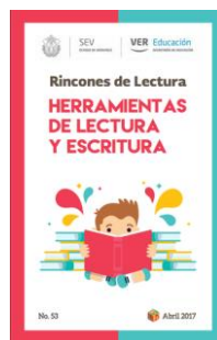
Imagen. – Libros del rincón de lectura 69

Proponiendo un espacio llamado él cuenta cuentos el cual la educadora pueda habilitar un aula exclusiva para leer fabulas de manera más llamativa utilizando personajes físicos como dibujos, muñecos etcétera de esa forma el alumno se concentrará más en la lectura la educadora pueda compartir con sus alumnos. 68