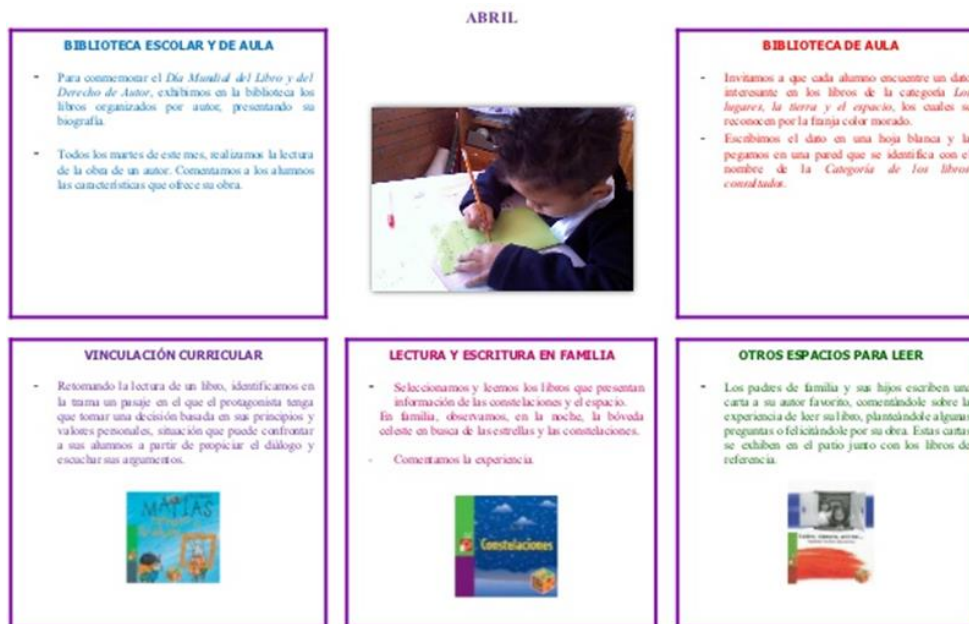
Imagen. – 5 acciones para hacer mejores lectores 65

“Lectura y escritura en familia Las actividades van encaminadas a fortalecer el proceso de formación de lectores y escritores desde el ámbito familiar” 66 .