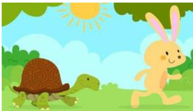
Imagen.- Fábula la tortuga y la liebre. 50

Al ser un grado académico básico “los niños tienen que empezar a poder mejorar su entonación y expresarse de mejor manera por que en esa etapa de crecimiento a los niños les cuesta trabajo poder hablar correctamente y la lectura puede mejorar entonación de las palabras” . 49