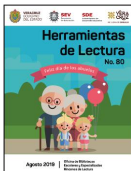
Imagen. – Apoyo a docentes 71

Con esto el Plan Nacional de Lectura en Preescolar también promueve que se manejen las actividades de lectura por medio de meses y evidencias que se tienen que incorporar a su portafolio de evidencias.