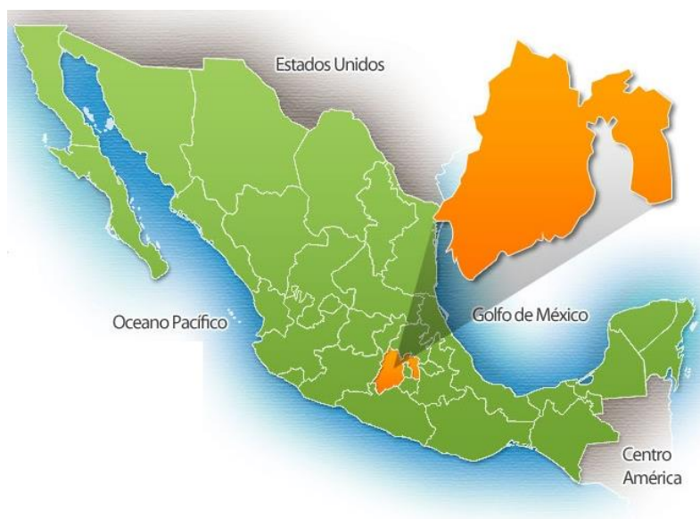
Imagen. - Mapa de La República Mexicana y Estado de México. 2

Los Estados Unidos Mexicanos, es un País de América ubicado en la parte Meridional de América del Norte. Su capital es la Ciudad de México compuesta por 32 Entidades Federativas (31 Estados y Ciudad de México). El territorio mexicano tiene una superficie de 1 964 375 Km 2 . Limita al Norte con los Estados Unidos de América a lo largo de una frontera de 3155 Km, mientras que al Sur tiene una frontera de 958 Km con Guatemala y 276 Km con Belice; las costas del país limitan al Oeste con el Océano Pacífico y al Este con el Golfo de México y el Mar Caribe, sumando 9330 Km. Cuenta con una población estimada de 119 millones de personas. 1