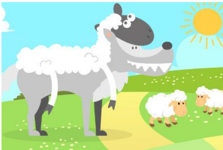
Imagen.- fabula El lobo disfrazado de corrdero 46 .

La importancia del desarrollo del lenguaje oral en la Etapa Preescolar a través de las fábulas, es debido a que ayuda a los niños a mejorar las habilidades de comunicación oral, tener una mejor pronunciación de las palabras, así como también la entonación de cada de una de ella y es que la lectura ayuda a mejorar de manera exponencial la comunicación.