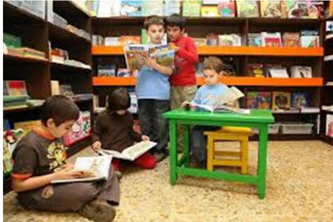
Imagen.- Biblioteca escolar 67

Otros espacios para leer Se invitan a que la comunidad escolar desarrolle actividades complementarias a las que se ofrecen en el aula y en la biblioteca escolar.