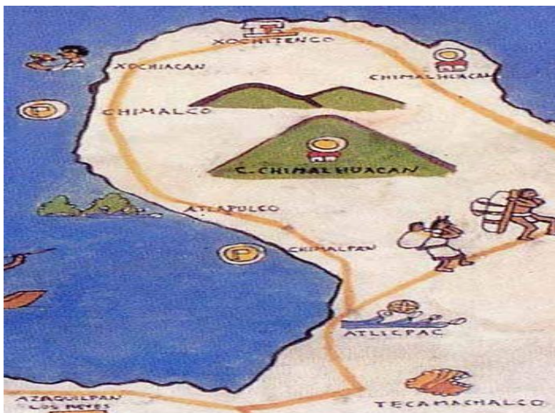
Imagen de los pueblos fundados. 12