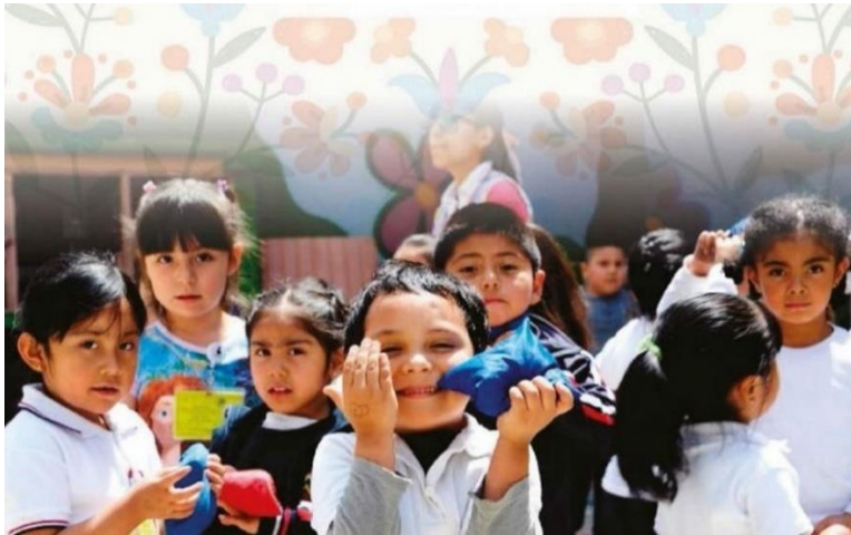
Imagen.- Escuela mexicana.

La NEM informa que los alumnos de Preescolar tendrán habilidades de comunicación y lenguaje para los futuros grados académicos, además nuevas expresiones y palabras de la lengua extranjera (Inglés), para ello es importante realizar las actividades que el Consejo Técnico Escolar propone para las buenas prácticas de la Nueva Escuela Mexicana, este nuevo proyecto educativo da la pauta para que los docentes de Educación Preescolar se retome urgentemente prácticas que favorezcan lo planteado en esta nueva propuesta nacional, que desde esta investigación es lo que se busca tener una herramienta pedagógica para lograr esta proeza dentro de los contextos tan complicados actualmente donde la Educación se ve como la salvaguarda de la sociedad mundial.