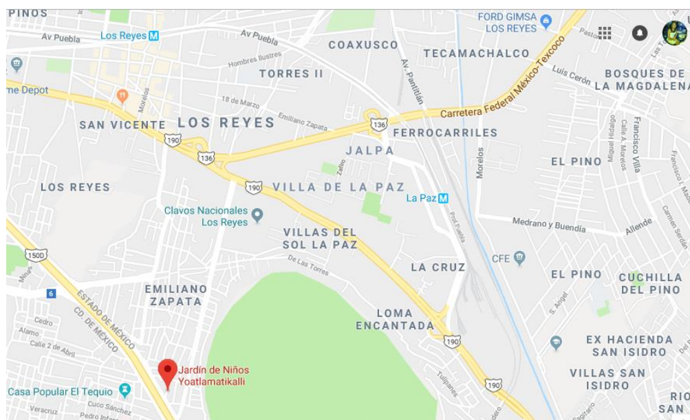
Croquis. - Ubicación del Jardín “Yoatlamatikalli”.

Jardín de Niños “Yatlamatikalli” se encuentra ubicado en la Calle Ignacio Allende, #62, Manzana 44, Lote 21, Localidad Los Reyes Acaquilpan, C.P. 56420, Municipio La Paz.