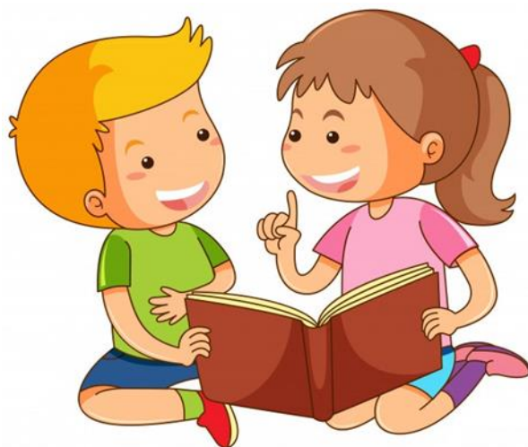
Imagen.- El hábito de la lectura 87

producciones marginadas en esa atención, entre las que ha estado, en alguna medida aun está, la literatura infantil.