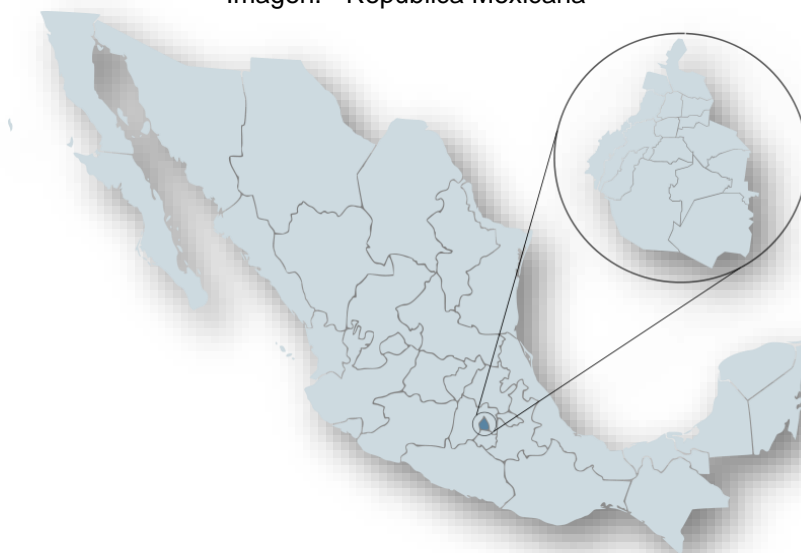
Imagen. - República Mexicana 1

La República Mexicana está localizada geográficamente en el extremo Sur de América del Norte, y cuenta con 32 Entidades Federativas de México, entre las cuales se encuentra la Ciudad de México, la cual se divide administrativamente en 16 Alcaldías.