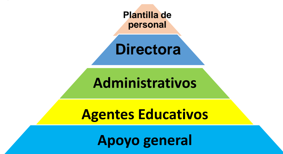
Imagen 3 organigrama de la institución