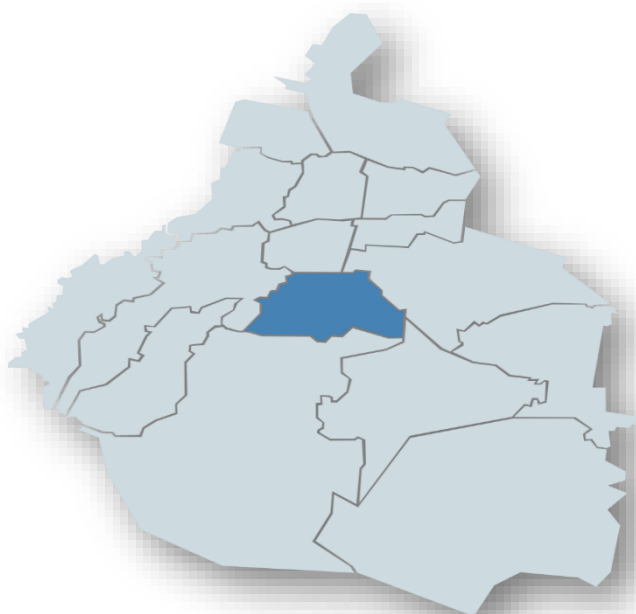
Imagen. - Ciudad de México 2

La Colonia Ajusco es una colonia de clase media ubicada al Sur de la Ciudad de México. La Colonia Ajusco se encuentra al Sur de la Alcaldía Coyoacán y su perímetro irregular la hace colindar con varias colonias como son Santo Domingo, Adolfo Ruíz Cortines, La Candelaria y Santa Úrsula, que comparten la misma historia de migración que dio lugar a estos asentamientos.