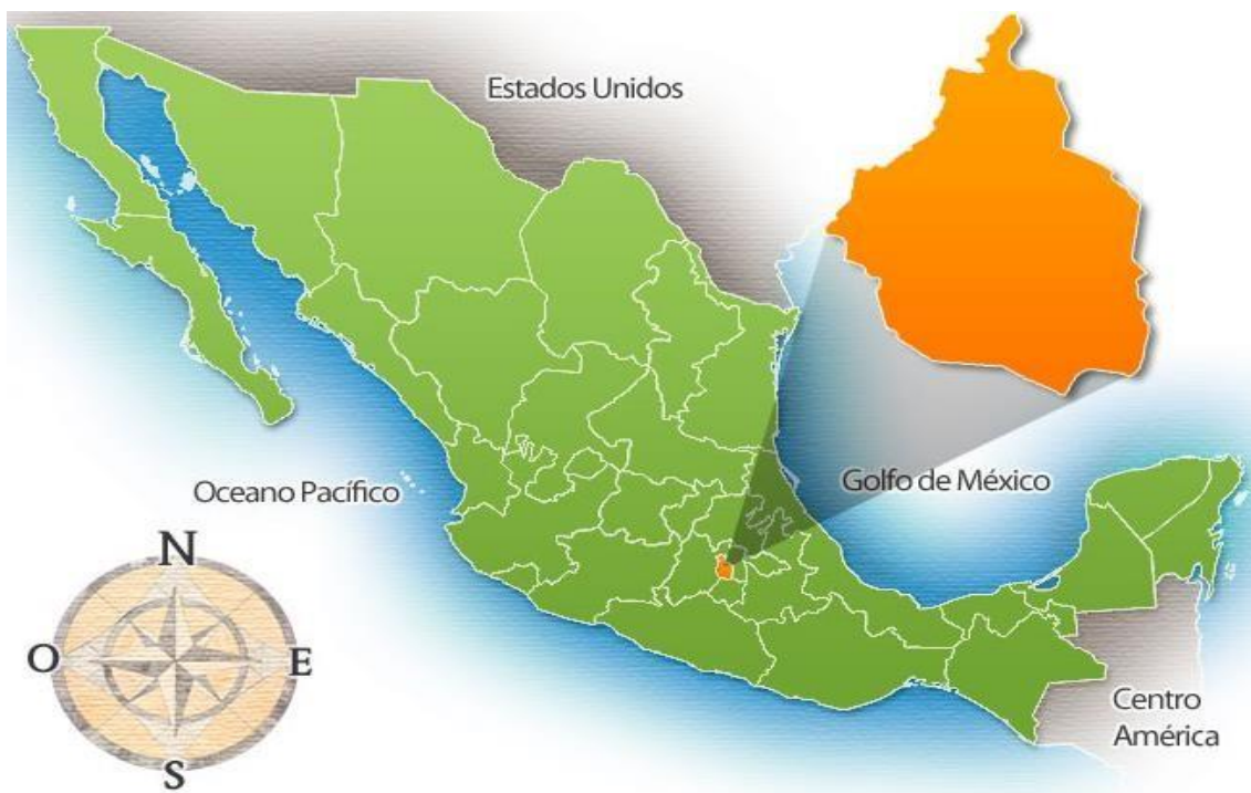
Imagen 1. Se muestra ubicación centralizada de la Ciudad de México 2