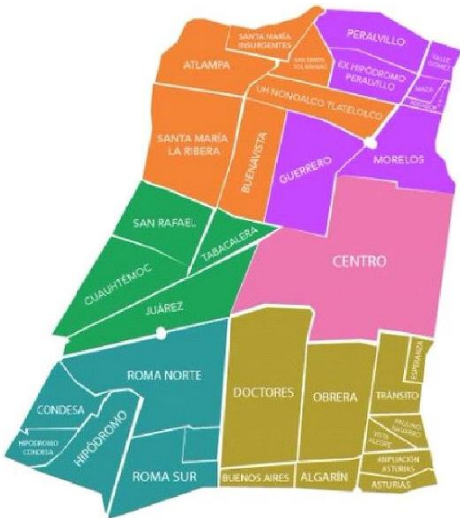
Imagen 2. Mapa territorial de la Alcaldía Cuauhtémoc 3