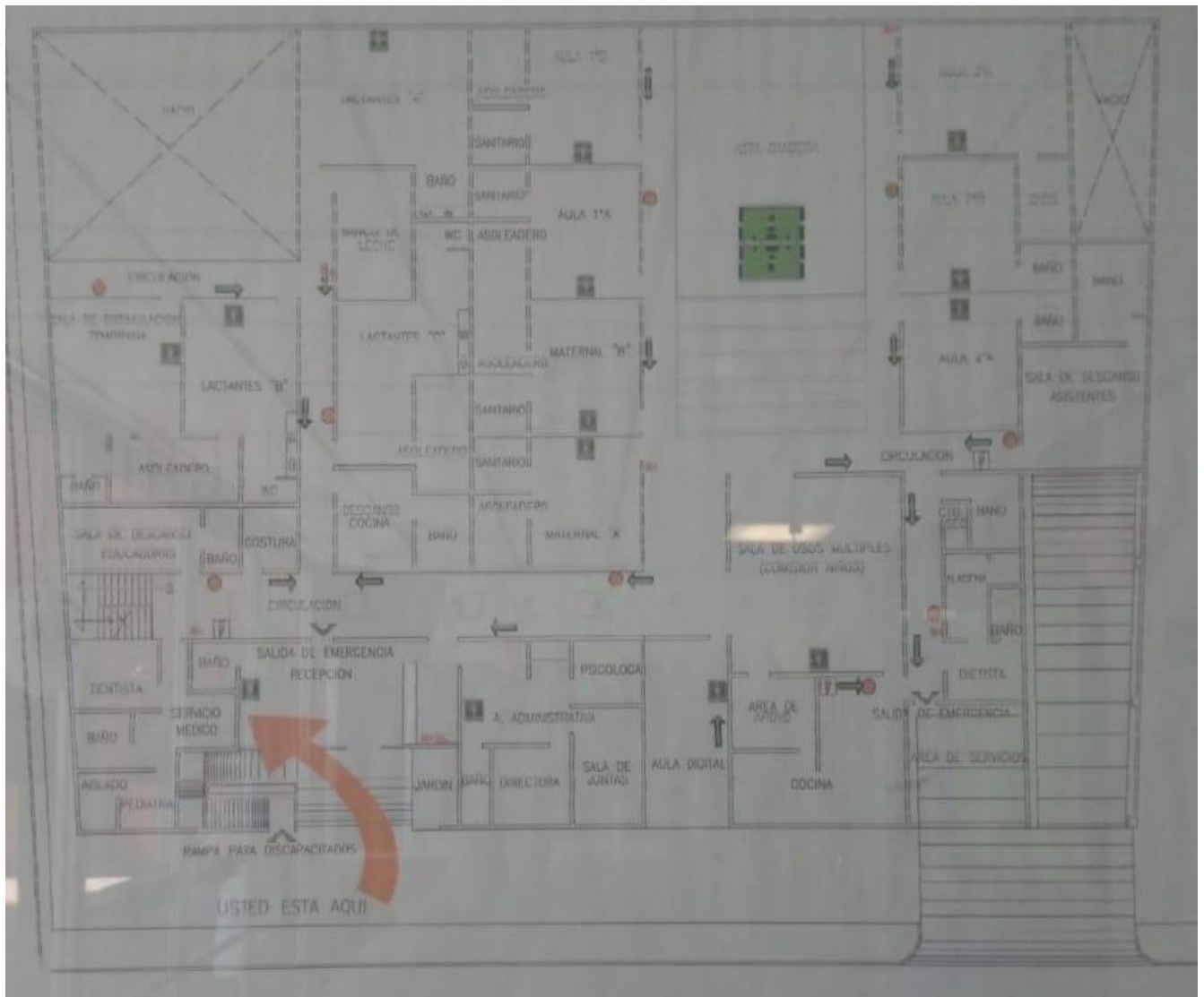
Imagen 4. Croquis de las instalaciones de la Guardería, Hugo Beckman 15