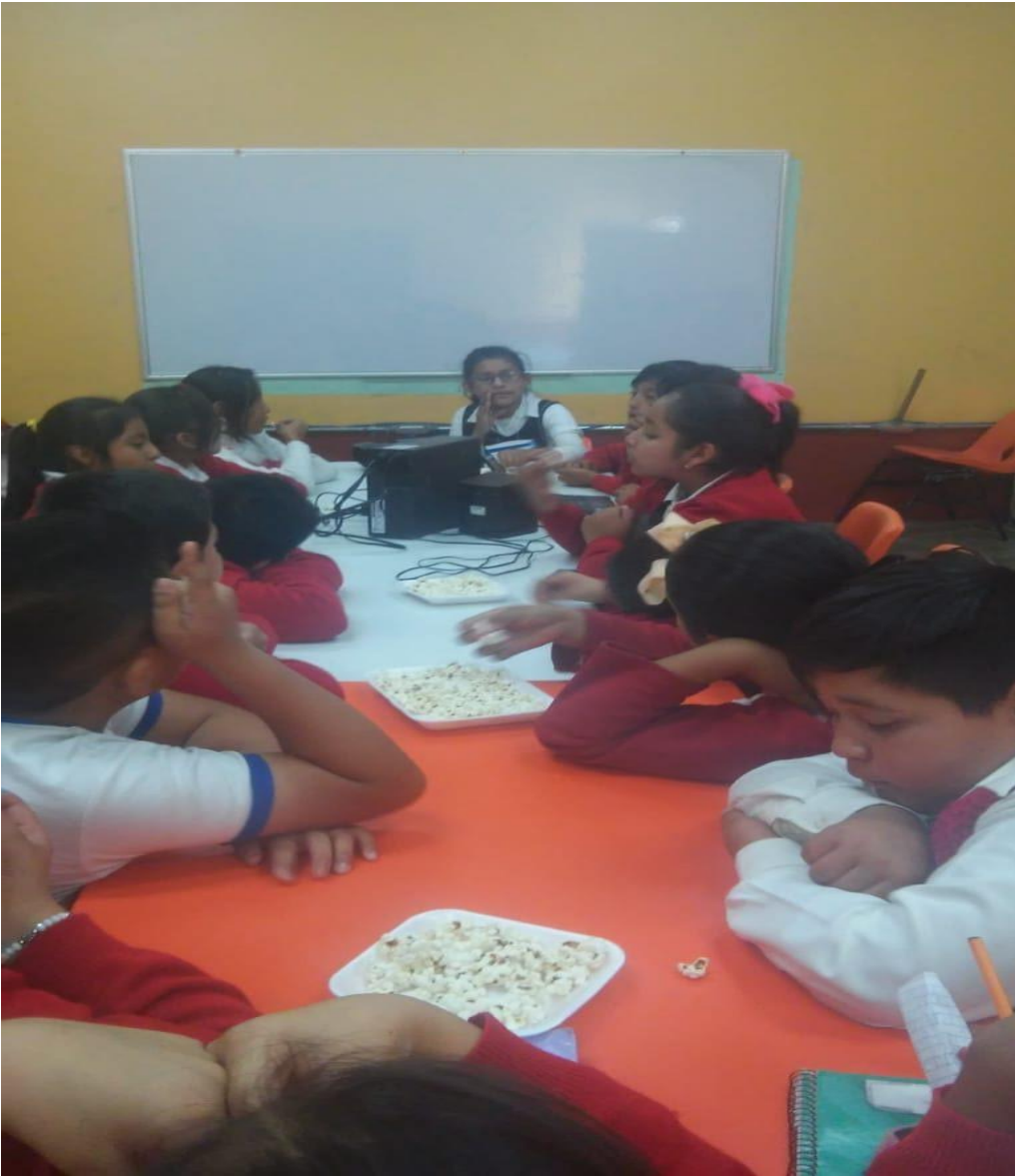
Los alumnos están comiendo palomitas después de haber visto los videos de Porfirio Díaz