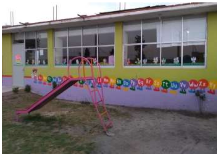
Salón de Segundo