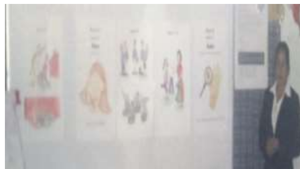
Exposición de carteles séptima sesión