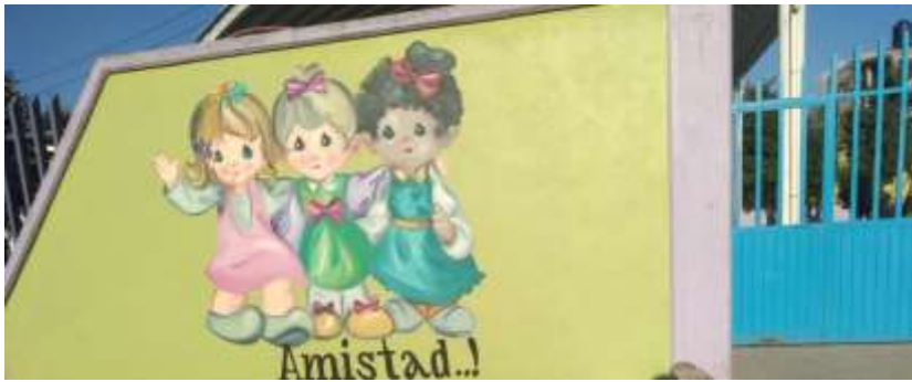
Fachada principal y camino para ingresar al Jardín de Niños