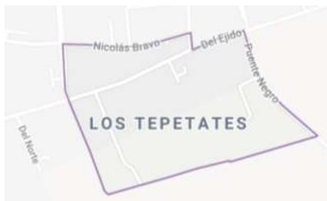
Mapa de la comunidad y camino para entrar al preescolar.