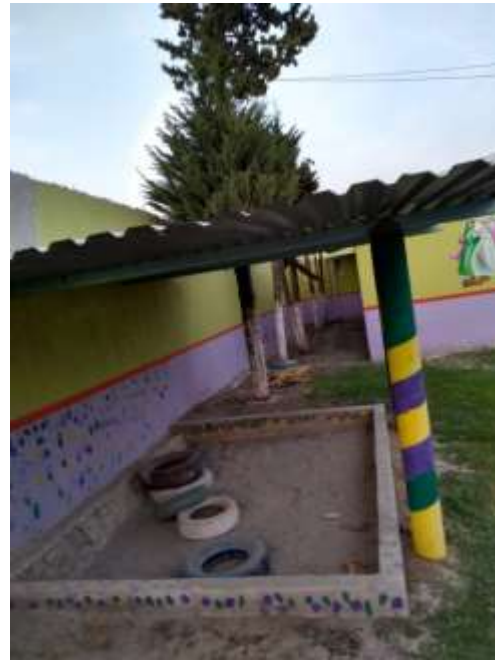
Arenero en algunas ocasiones las maestras realizaban actividades dirigidas.