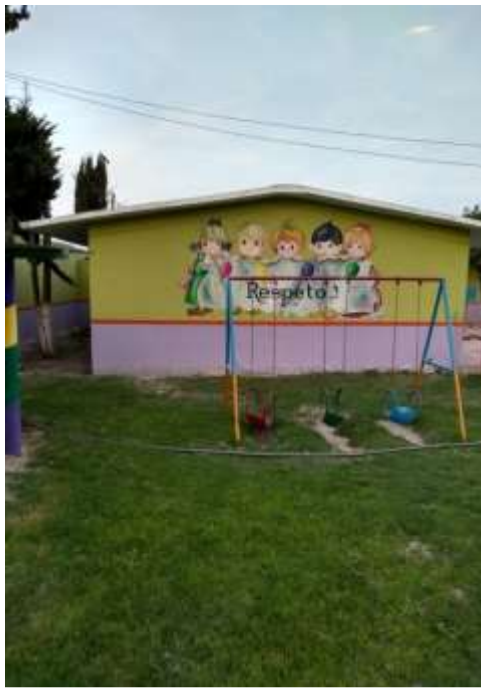
Columpios, lugar donde los alumnos pasaban gran parte del recreo