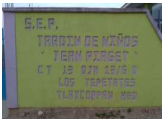
Fachada de la escuela