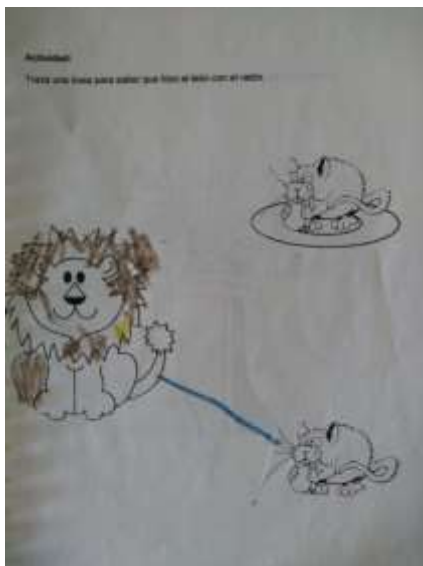
Trabajo realizado por uno de los alumnos.