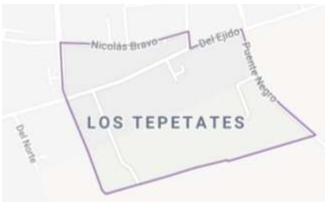
Mapa de la colonia en la que se distinguen algunas de las calles que la conforman

Anexo 20. Mediante las imágenes podemos darnos una idea de las características físicas del plantel.