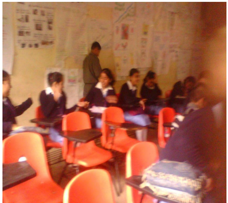
Fotografía 2. Se muestra que algunos de los alumnos no están en clases