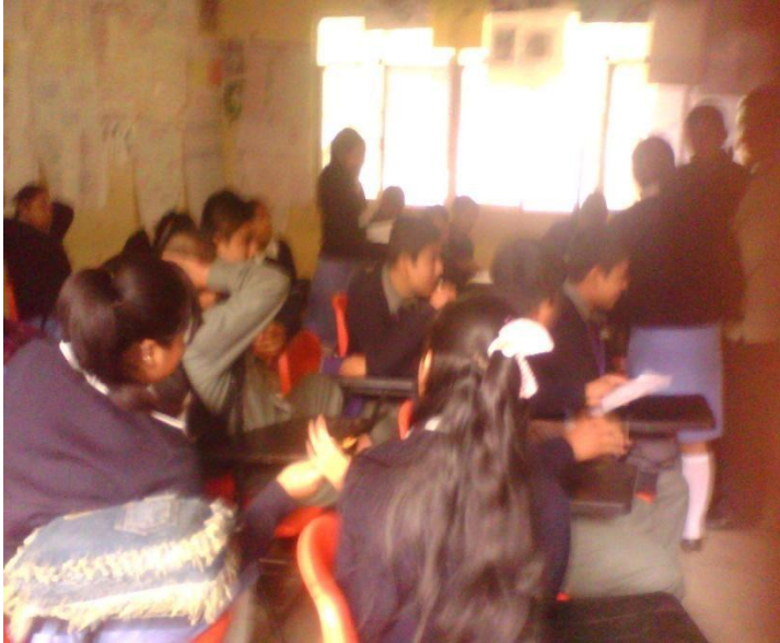
Fotografía 1. Se muestra que algunos de los alumnos andan parados.