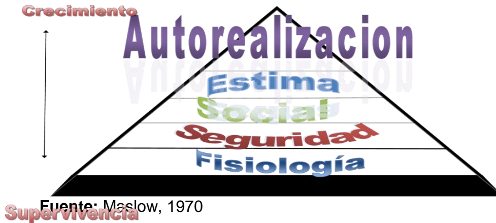
Figura 1. Pirámide de Maslow

Estas pirámides de las necesidades del ser humano exponen de mayor importancia a menor leyendo de abajo hacia arriba: