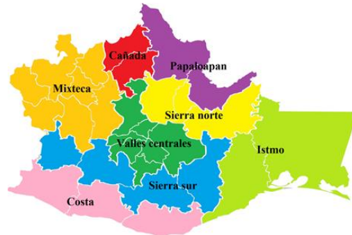
Mapa número 1. Fuente. Google maps.

https://www.google.com/search?q=GOOGLE+MAPS+MOSTRAR++MAPA++DE+LAS+OCHO+REGIONES+DEL+ESTADO+DE+OAXACA&sxsr=AleKk01ZGUYbDVYjA1JRA7FYo2ZJGxGg:1615069159544&tbm=isch&source=iu&ictx=1&fir=qLoY9WKcVdeqM%252CqTZcEhP6_C4z8M%252C_&vet=1&usq=A14_kRmh7EppwOKrLzOzO84kf4MBFU7lq&sa=X&ved=zahUKewiu7Kq82ZvAhUJRgwkHQUIBRwQ9QF6BAgfEAE#imgrc=TiHmFqG5GsXpM