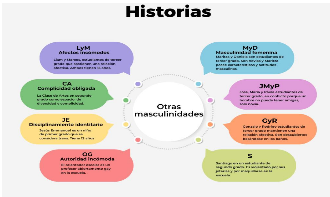
Gráfico 3 Elaboración propia

Cabe recordar que las historias son parte fundamental del análisis y discusión conceptual de este trabajo, por ello, se recuperan y presentan de manera sintética todas las historias en el siguiente gráfico