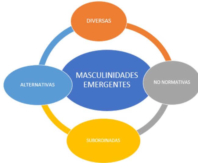
Gráfico uno

Como se observa en el gráfico anterior, las masculinidades emergentes que se recuperan a representan algunas solo algunas perspectivas desde las cuales se pretende ampliar el significado de la experiencia de ser hombre o lo que signifique, no obstante no son las únicas. Se muestran como resultado del trabajo académico y de investigación que se realiza desde diferentes disciplinas.