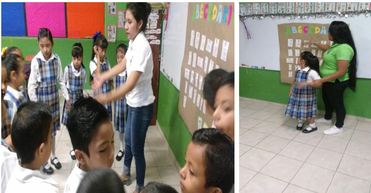
Anexo 9. Actividad en la que se practicó el abecedario en lengua de señas mexicano.