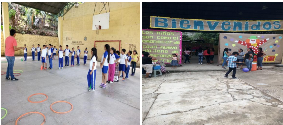
Anexo 5. Se observó al grupo de alumnos para delimitar la población con la que se llevaría a cabo el proyecto de intervención.