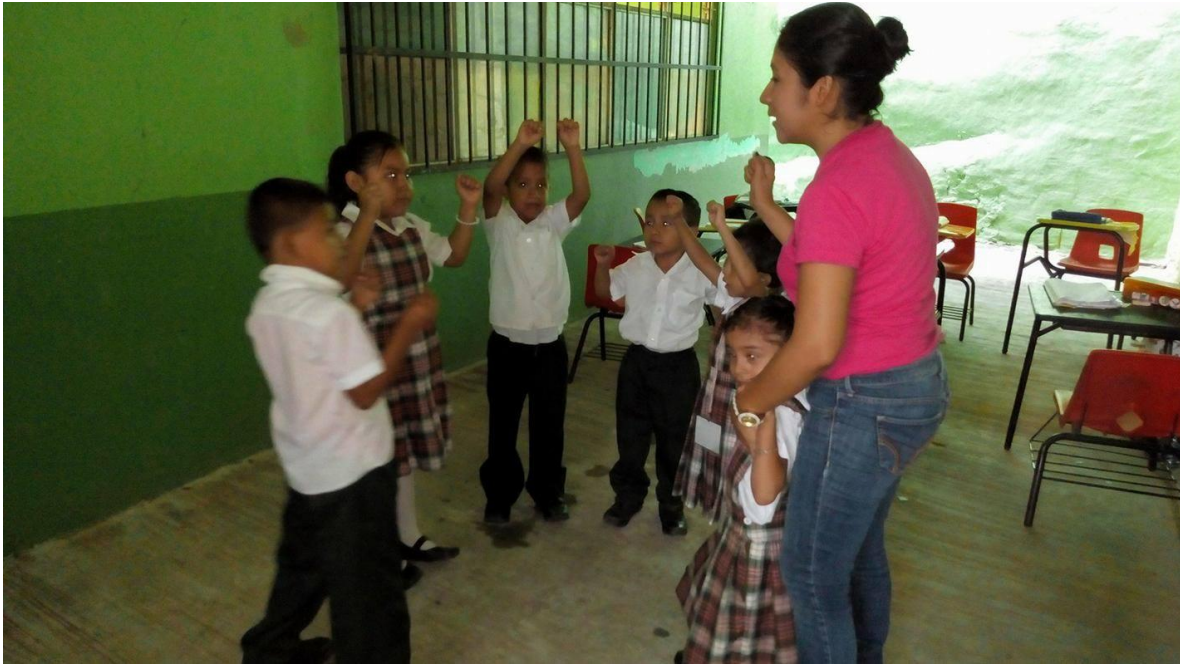
Anexo 8. En la fotografía se observa el desarrollo de la dinámica “Los patitos pichin pichin”