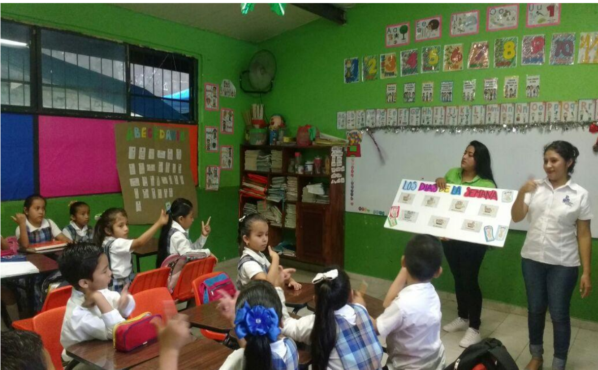
Anexo 7. En la imagen se observa la actividad de aprendizaje de los días de la semana en lengua de señas mexicana.