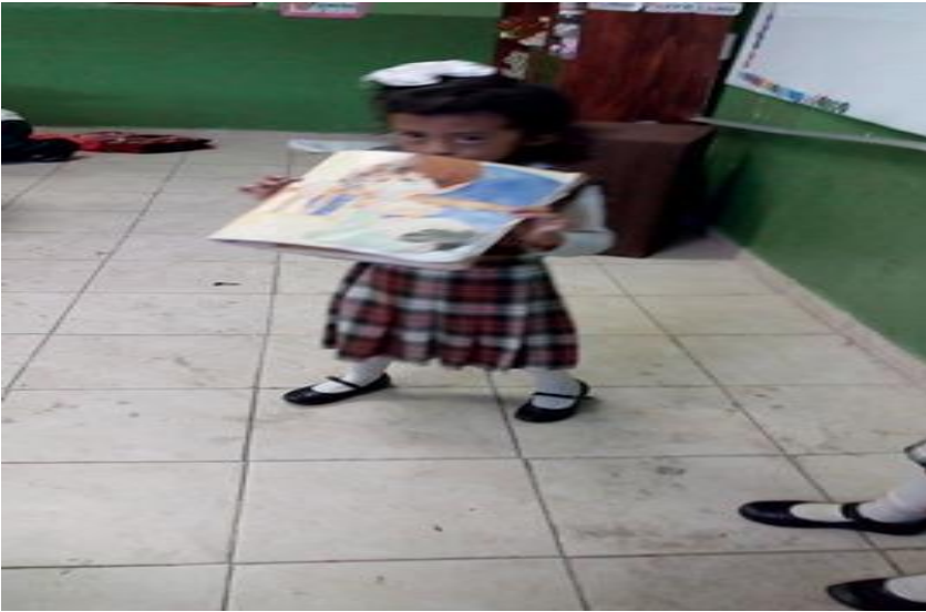
Anexo 6. Actividad para aprender a decir sus nombres en lenguaje de señas mexicana.