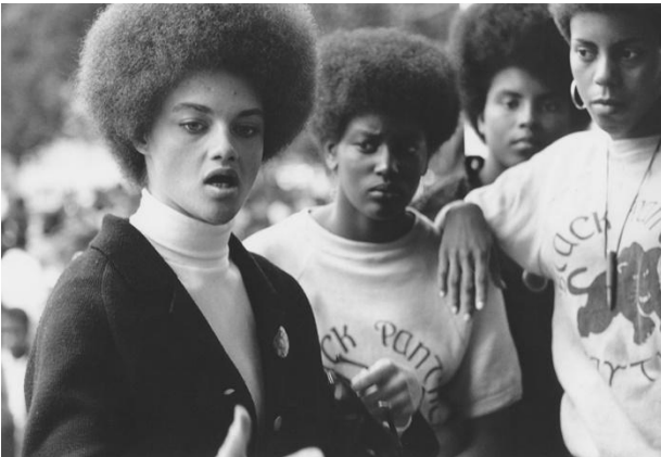
(Imagen tomada de la red. Kathleen Cleaver y sus compañeras afroamericanas)

Sin duda la práctica y la formación de las mujeres negras dentro del BPP fue una era que marcó el cómo las mujeres ganaron su propia autonomía, superando las tendencias sexistas en los primeros años del Partido. La presencia femenina generó una voz propia, lograron exponer los valores masculinizados de sus compañeros de luchas, dejando ver un eje patriarcal criticaba la inclusión de mujeres dentro del (BPP). Tan solo personalidades como Elaine Brown así como Kathleen Cleaver enarbolaron un papel como mujeres lideresas que luchan en contra el racismo y el sexismo desde el partido.