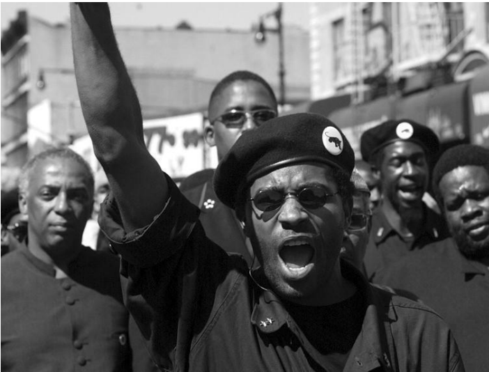
Levantamiento del poder negro (Black Power)

Políticamente, el movimiento Poder Negro, era nacionalista, radical, repudiaba la violencia, se puede encontrar una mezcla de categorías nacionalistas negros, entre ellos los negros ortodoxos y los musulmanes etc. La estructura del Poder Negro luchó porque la mayoría de representantes negros fueran los apropiados para representar las colonias. La intervención policial contra los líderes del movimiento negro desató una gran controversia, por ello uno de los líderes Eldridge Cleaver, decía lo siguiente en una entrevista el 13 de abril de 1968; “reconocemos el problema planteado al pueblo negro por el sistema económico-capitalista. Repudiamos al sistema económico capitalista. Reconocemos la naturaleza clasista de dicho sistema, así como su dinámica. Al mismo tiempo reconocemos el carácter nacional de nuestra lucha. Reconocemos el hecho de que hemos sido oprimidos porque somos negros, aunque sabemos que esta opresión se debió a la explotación. Tenemos que tratar tanto con la explotación como con la opresión racial, y no creemos que se pueda lograr un equilibrio correcto si se descuida una o la otra” 57