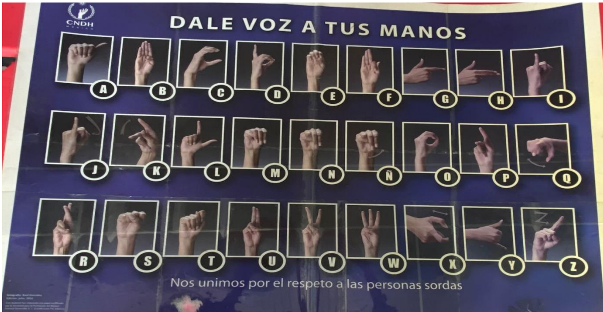
910 Elaboración propia Abecedario en Lengua de Señas Mexicana