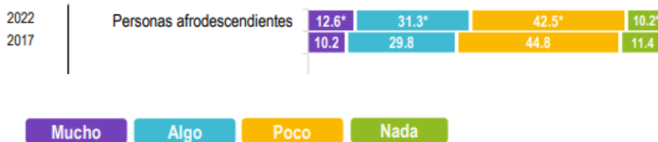
Ilustración 1. INEGI. La percepción sobre el respeto a los derechos de cada grupo de interés por la población en general. Imagen extraída de: Presentación Encuesta Nacional sobre Discriminación (ENADIS: 2022)

Según datos del INEGI en estos casos sí existió un cambio estadísticamente significativo con respecto del ejercicio anterior; en dicha encuesta se realizó un apartado denominado “Población afrodescendiente”, en el cual se obtuvieron los siguientes resultados: