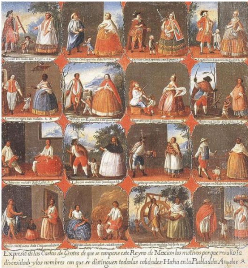
Ilustración 2 Artista anónimo, “Expresión de las Castas de gentes de que se compone este Reino de México; los motivos porque resultó la diversidad; y los nombres con que se distinguen todas las calidades: Hecha en Puebla de los Ángeles”, ca. 1750. imagen extraída de Una historia de civilización Ma. Eliza Iturralde .