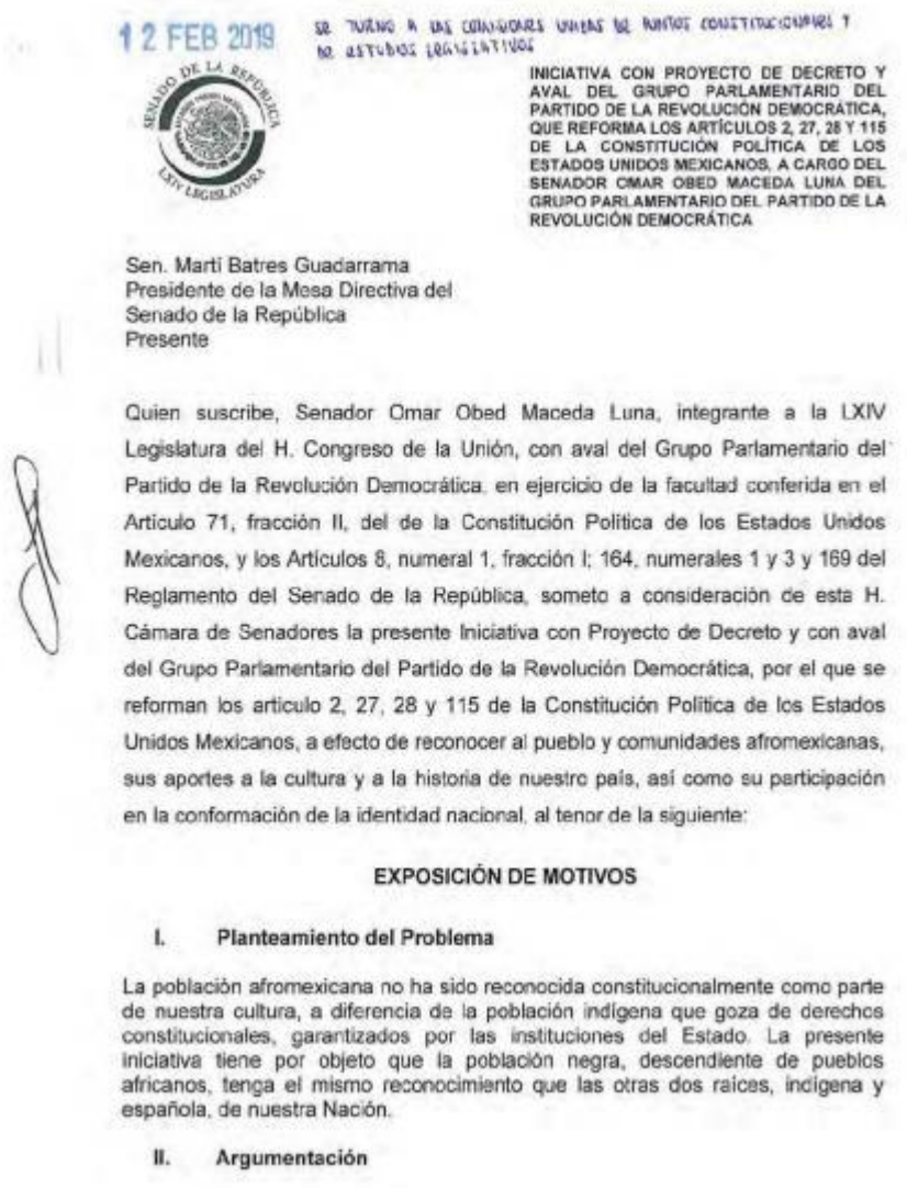
Imagen1. 239_DOF_09ago19. Cámara de Diputados

reconocer al pueblo y comunidades afroamericanas, sus aportes a la sociedad mexicana, así como su participación en la formación de una identidad nacional. (imagen 1)