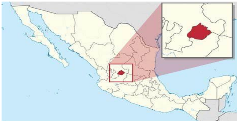
FIGURA 1. UBICACIÓN DE LA CIUDAD DE MÉXICO 8