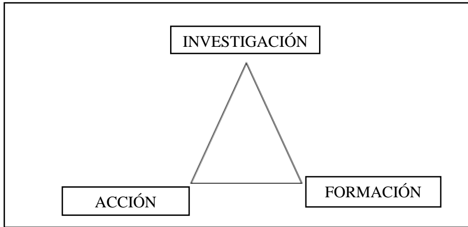
Cuadro 1 Triángulo de Lewin (1946), en Latorre (2003)

Se establece el propósito de hacer más eficaz la práctica relacionando a todos los docentes proponiendo un protagonismo activo y autónomo siendo ellos quienes seleccionan las situaciones de conflicto o de mejora, se genera a través de las observaciones y de las reflexiones que se emiten de forma individual y que conllevan a la comunidad; es aquí donde hago una pausa a esto. La situación educativa se integra no solo de los docentes, directivos y alumnos; se integran a los Padres de Familia como educadores iniciales y principales en la educación de los niños y de las niñas.