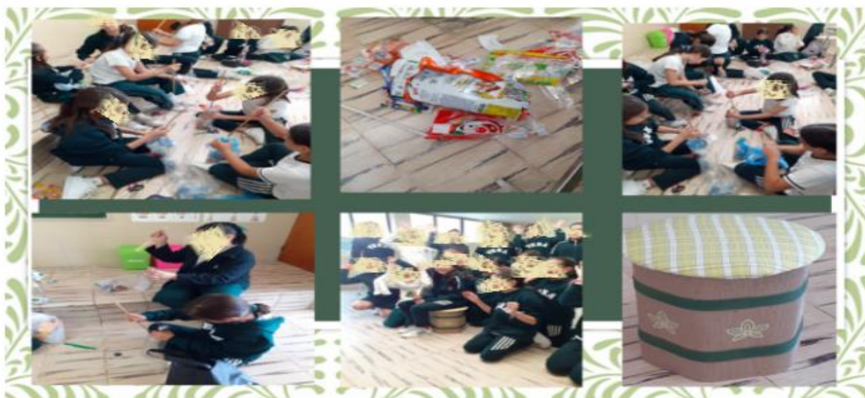
Figura No. 7 Las alumnas están contentas con el resultado final del proyecto.