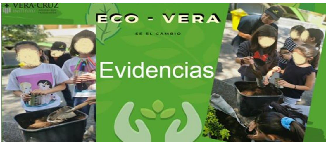
Figura 9. Alumnas planteando la semillas para observar el proceso de crecimiento.

La Figura No. 9 muestra cómo las alumnas participaron y se organizaron para llenar su bote con la tierra necesaria, y después colocaron la semilla. Cada una de ellas escogió qué sembrar y en equipo platicaban su interés por cada una de las semillas que se les proporcionó.