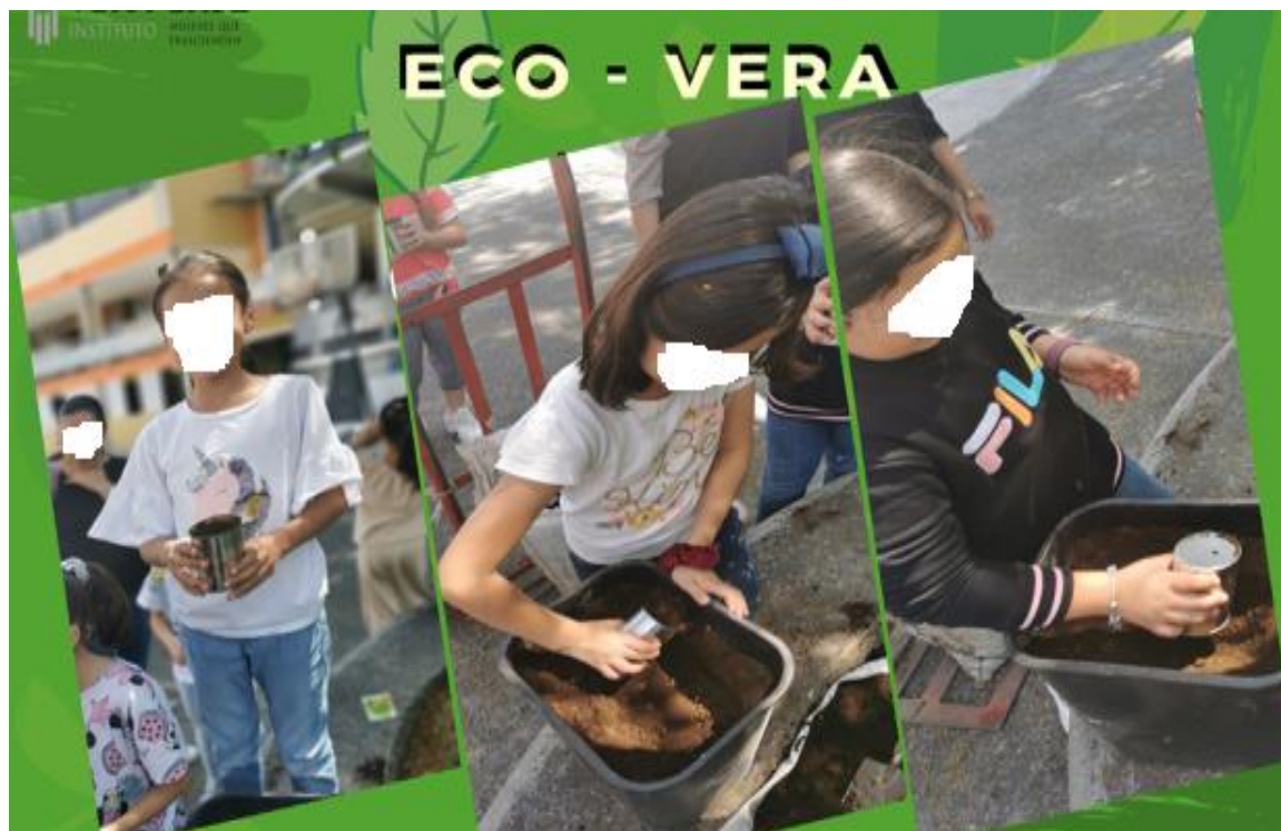
Figura No. 10. Alumnas plantando semillas en la tierra utilizando macetas de material reciclado

En la Figura siguiente (No. 10) se muestra cómo evolucionó la actividad, las alumnas descubrieron que la semilla es un órgano de gran importancia para la planta ya que cumple las funciones de dispersión, protección y reproducción de la especie. A partir de esta actividad identificaron que las semillas necesitan agua, oxígeno, y una temperatura apropiada para germinar. Algunas semillas también requieren luz apropiada. Otras germinan mejor con luz total mientras que otras requieren oscuridad para germinar”.