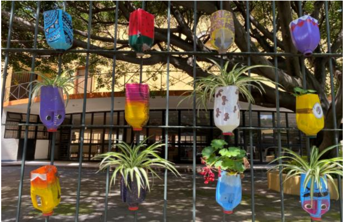
Figura No. 11 Las alumnas colocaron las macetas en el jardín de la institución.