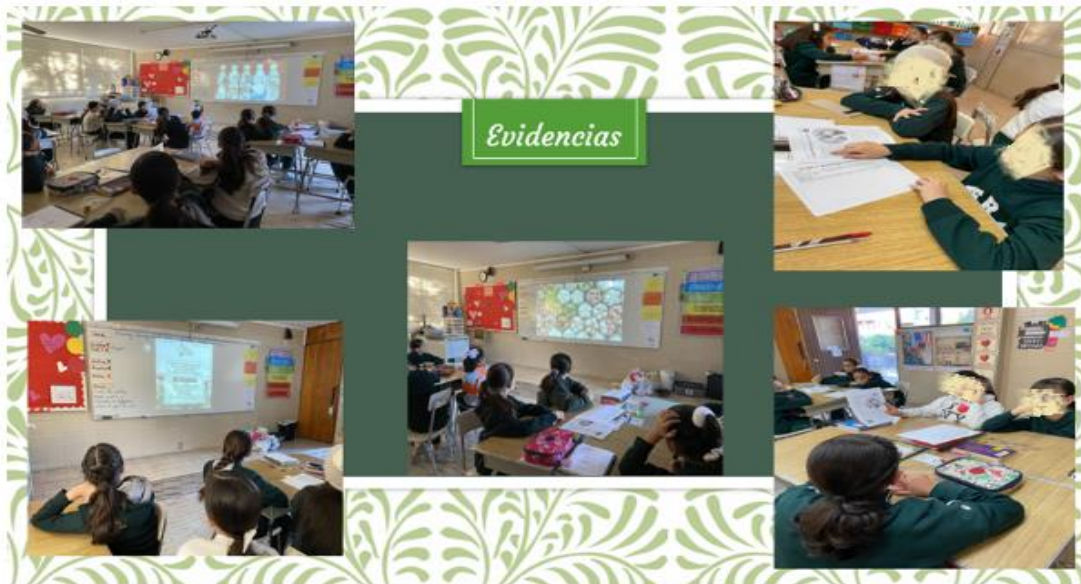
Figura No. 5 Las alumnas están comenzando a planear el proyecto de reciclado.

correctamente”, lo que les permitió alcanzar los aprendizajes previstos, tal como: “darles confianza a las alumnas para que expliquen qué cómo utilizaron los desechos inorgánicos para hacer un artículo de uso diario”.