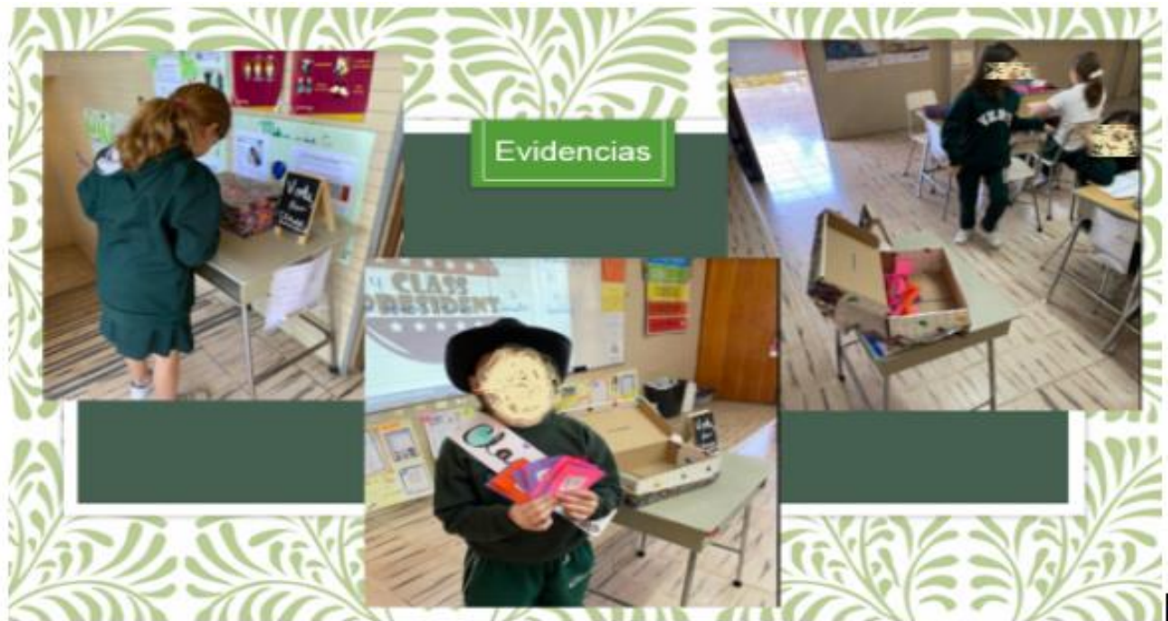
Figura No. 4 Las alumnas usando la urna y haciendo su votación en secreto.

Al finalizar la actividad todas mostraron empatía, ya que sabían que solo una de ellas era la presidenta de la clase, así que aquí trabajamos tolerancia, trabajo en equipo y solidaridad.