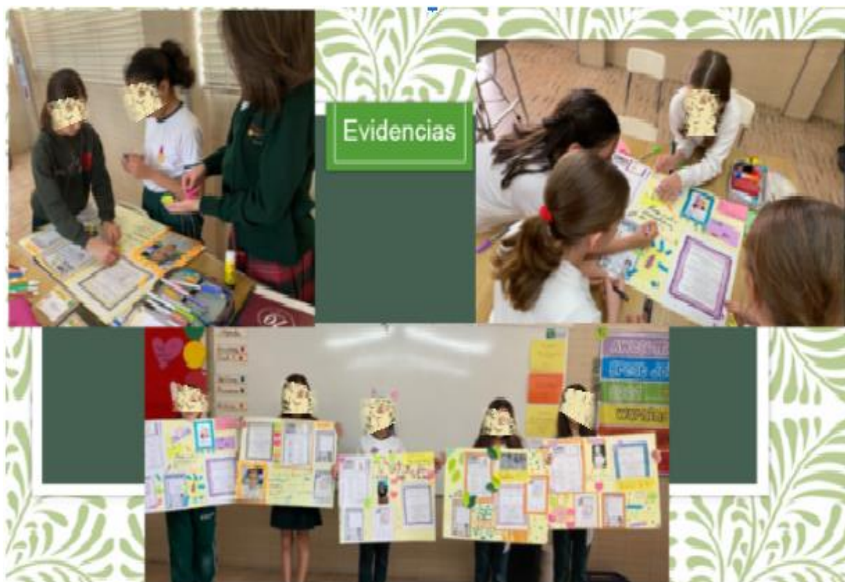
Figura No. 3 Las alumnas trabajando en su campaña electoral para ser presidenta del salón.

La actividad que observamos en las Figura No. 3 está relacionada con la campaña de elección que realizaron por medio de la inclusión, primero se les explicó cómo trabajar el tríptico, observamos un ejemplo de cómo hacer su tríptico, se involucraron en las actividades y la respuesta fue favorable porque, de acuerdo a la rúbrica, las alumnas “Tiene mínimos errores al hablar. Una correcta fluidez y demuestra confianza al hablar”. Lo cual les permitió alcanzar los aprendizajes previstos, tal como: “se sientan cómodas y en la clase podrán hacer las impresiones necesarias para la elección”.