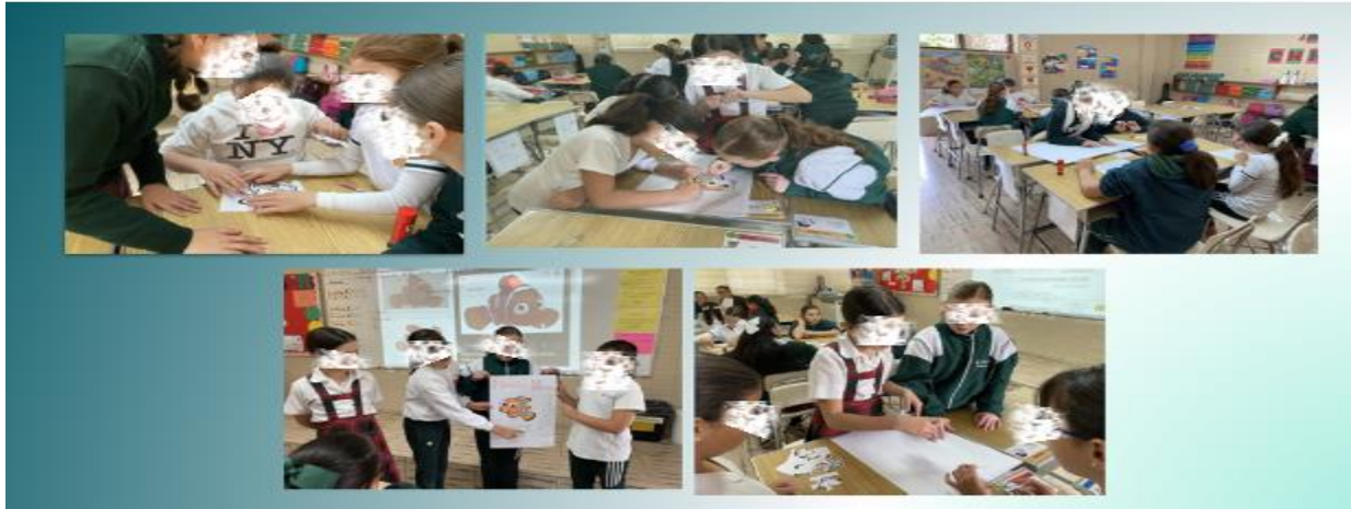
Figura No. 1 alumnas trabajando en equipo para exponer su cuento.

La actividad que observamos en las Figura No. 2 está relacionada con el trabajo en equipo, primero se les explicó como trabajar el poster y observamos un ejemplo de cómo hacerlo, se involucraron en las actividades y la respuesta fue favorable porque, de acuerdo a la rúbrica, las alumnas se involucraron en el saber escuchar y expresar sus propias ideas, emociones y sentimientos”.