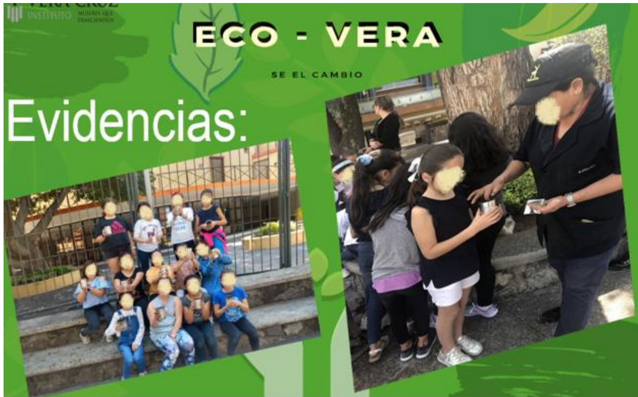
Figura No. 8 Las alumnas plantando semillas para ver el proceso de crecimiento.

La Figura No. 9 muestra cómo las alumnas participaron y se organizaron para llenar su bote con la tierra necesaria, y después colocaron la semilla. Cada una de ellas escogió qué sembrar y en equipo platicaban su interés por cada una de las semillas que se les proporcionó.