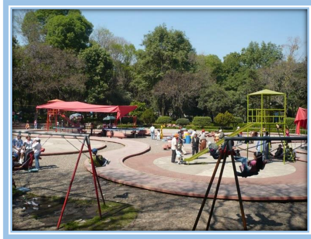
Fotografía. 4 Parque de los Venados

Además, cuenta con parques, entre los que destacan: el Parque de los Venados, ubicado en Avenida División del Norte, y Parque Hundido, ubicado en Avenida Insurgentes Sur sin número.