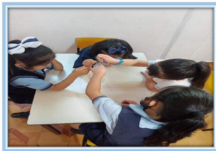
Fotografía 34- Equipo el pozo (Rescatando a los animales que cayeron al pozo)

El equipo ganador fue el equipo del “pozo” para sacar a los animalitos del pozo, lo hicieron sacando uno a la vez, es decir; primero una, después detrás de ella otra y así hasta sacar los cuatro animalitos, fue buena estrategia.