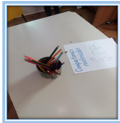
Fotografías 28 y 29.- Niños dibujando la representación de reglas.