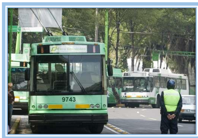
Fotografía. 2 Transporte publico