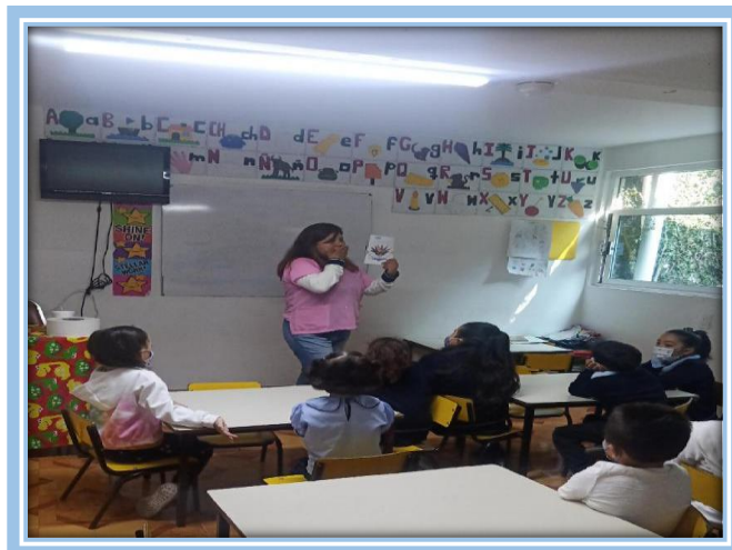
Fotografía 19.- Lectura de los cuentos “Igual pero diferentes”

Todos los alumnos escucharon el cuento atentamente