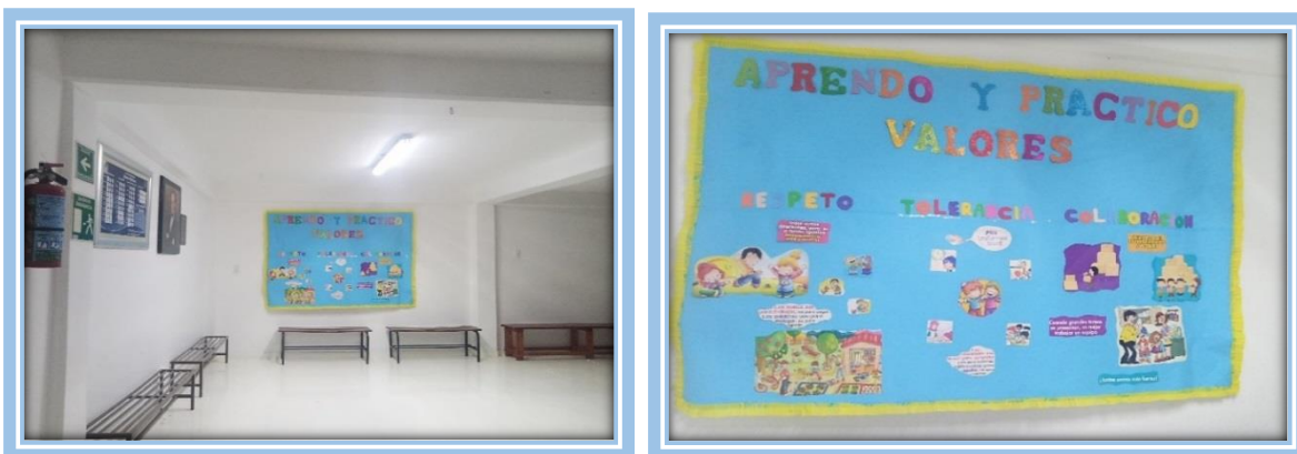
Fotos 17 y 18-Periódico mural de valores.