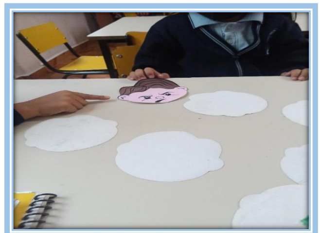
Fotografías 25 y 26.- Evidencias de la actividad