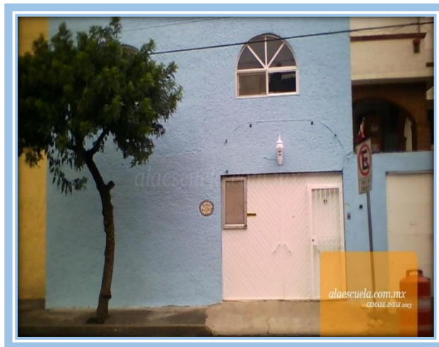
Fotografía. 1 Vista exterior del Instituto pedagógico “Simón Bolívar”

La comunidad cuenta con todos los servicios tales, como: agua potable, luz, drenaje y alumbrado público, en esta colonia la mayoría de la comunidad cuenta con cisterna y tinaco, así como sistema de cable, telefonía fija, telefonía móvil e internet.