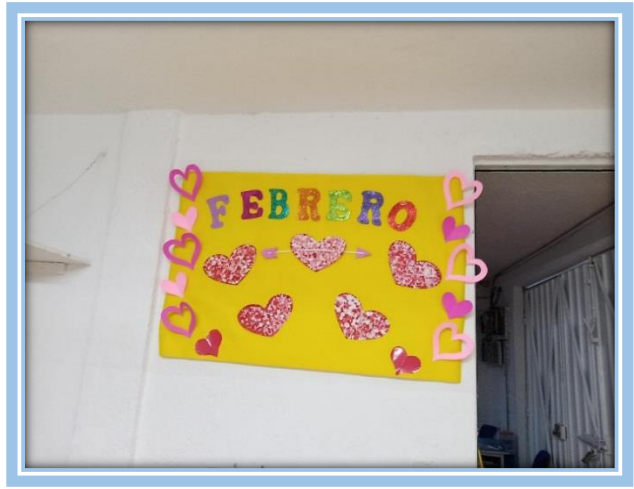
Fotografías 30 y 31.-Decoración del salón (corazones representando cada valor y corazones hechos por los alumnos)