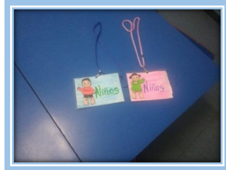
Fotografías 13 y 14.- Baños del área de preescolar y gafetes de control de permiso para la salida al baño del Instituto Pedagógico “Simón Bolívar”

9) Área de cocina y un comedor: En esta área, la persona responsable de los alimentos, prepara los mismos, con las debidas precauciones de higiene, utilizando gorro y materiales debidamente desinfectados. Los alimentos se preparan de acuerdo a una dieta balanceada, que satisface las necesidades de nutrición de los niños. Esta área es utilizada por los estudiantes de tiempo completo, los cuales desayunan y comen.