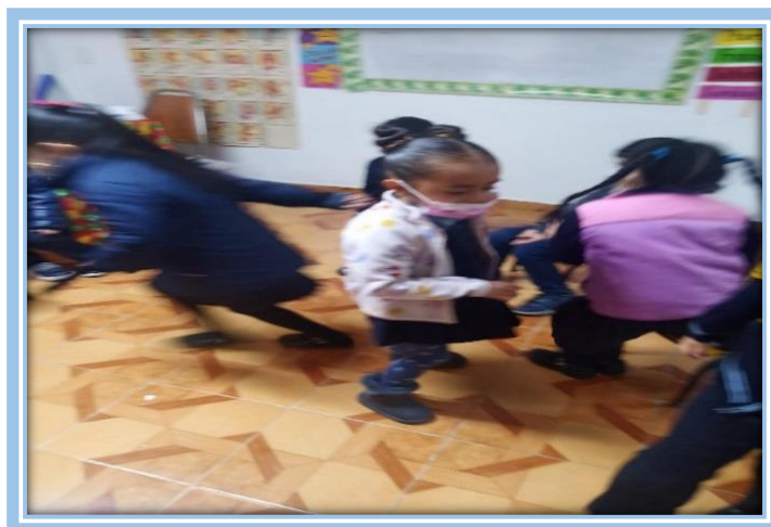
Fotografía 22. Juego de integración, cóctel de frutas