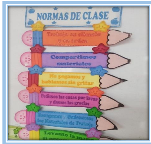
Fotografía 27.- Reglamento de clase