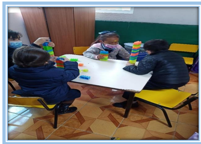
Fotografía 36.- Equipo de construcción (Alumnos construyendo un edificio)

En el tercer equipo, pude observar que no trabajaron en equipo, cada uno comenzó a realizar su propia construcción.