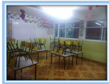
Fotografías 9 y10.- Aulas de preescolar del Instituto Pedagógico "Simón Bolívar"