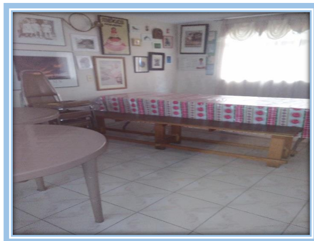
Fotografía 15.- Área de cocina y comedor del Instituto Pedagógico “Simón Bolívar”

9) Área de cocina y un comedor: En esta área, la persona responsable de los alimentos, prepara los mismos, con las debidas precauciones de higiene, utilizando gorro y materiales debidamente desinfectados. Los alimentos se preparan de acuerdo a una dieta balanceada, que satisface las necesidades de nutrición de los niños. Esta área es utilizada por los estudiantes de tiempo completo, los cuales desayunan y comen.