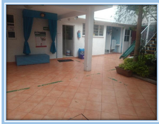
Fotografía 8.- Patio principal del Instituto Pedagógico "Simón Bolívar".