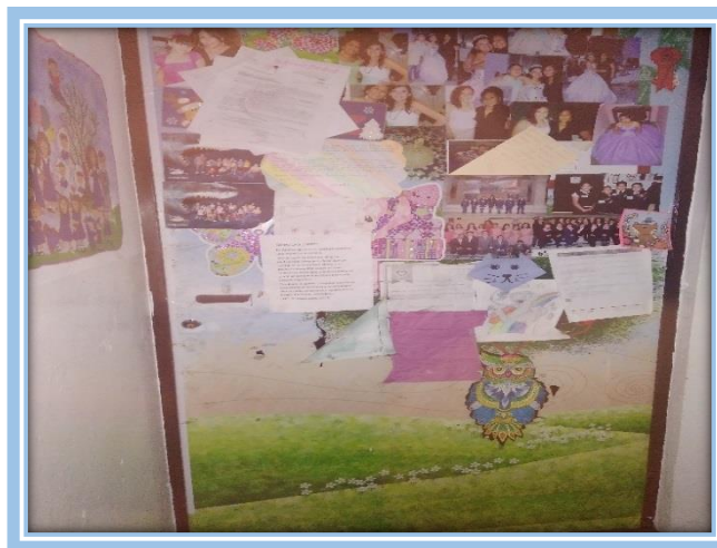
Fotografía 7.-Dirección escolar del Instituto Pedagógico “Simón Bolívar”