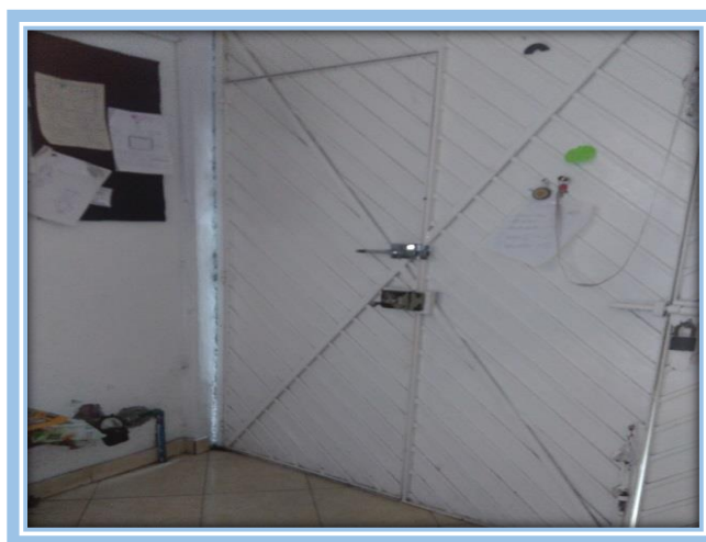
Fotografía. 5 Entrada Principal del Instituto Pedagógico “Simón Bolívar