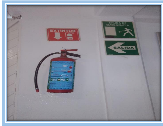
Fotografía 6.- Salidas de emergencia del Instituto Pedagógico “Simón Bolívar”