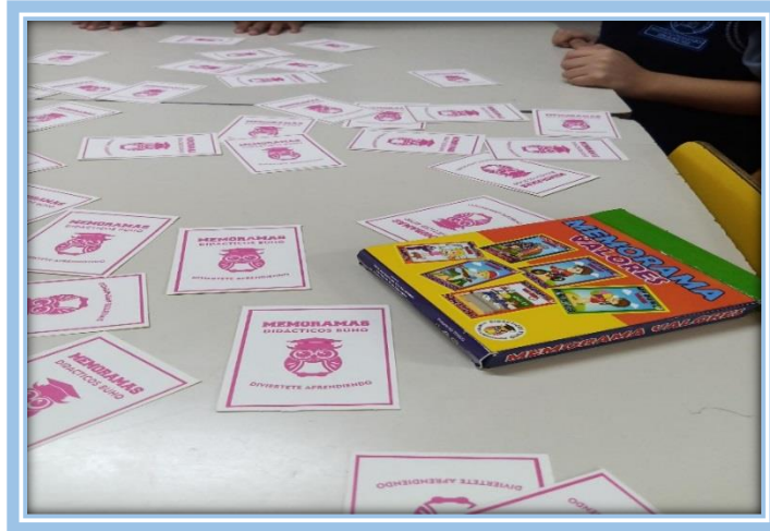
Fotografías 32.- Alumnos jugando el juego de memorama de valores