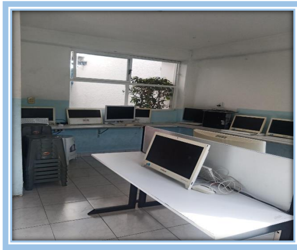
Foto 11.-Equipo de cómputo.

6) Aula de cómputo: En esta área se imparten las clases de computación una vez por semana.