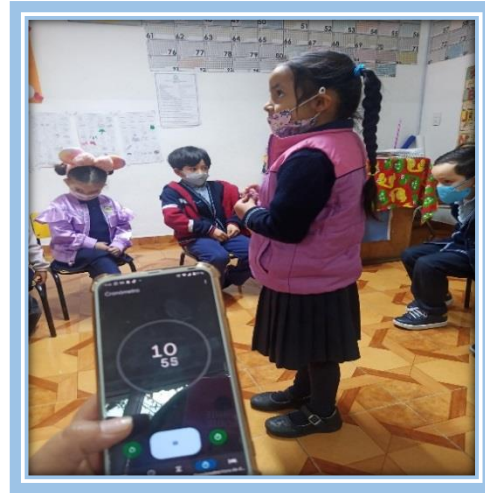
Fotografías 23 Y 24: Alumnos jugando el juego “El detective” investigando ¿Quién falta?