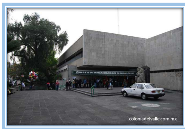
Fotografía. 3 Unidad Médica Familiar, número 28

La alcaldía cuenta con hospitales, clínicas y consultorios tanto del sector público como privado. La clínica más cercana es: Unidad de Medicina Familiar número 28 del Instituto Mexicano del Seguro Social, ubicada en la calle Gabriel Mancera, Número 800, Colonia del Valle Centro.