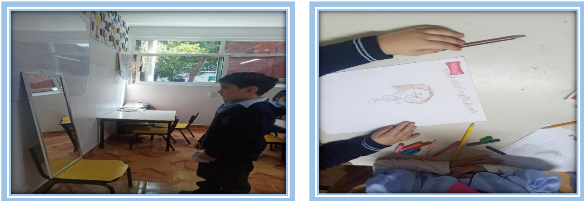
Fotografías 20 y 21.-Evidencias de la actividad.

Maestra: “Ahora vamos a realizar una actividad que consiste mirarnos en el espejo y observar nuestras características físicas, posteriormente les daré una hoja blanca y nos vamos a dibujar, ocupen todo el espacio de la hoja y no olviden hasta el último detalle”.