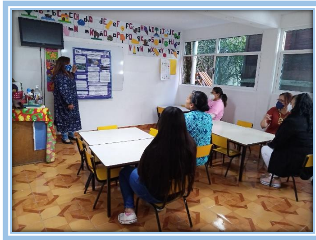
Fotografía 16.- Directivo y maestras en reunión de la Fase de Sensibilización