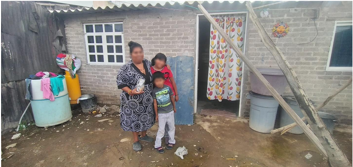
Imagen 6. Primera familia que participó en las entrevistas.

veces no entiende y le gustaría que le pudiera ayudar, muy gustosa accedí, al anochecer me mando mensaje por WhatsApp.