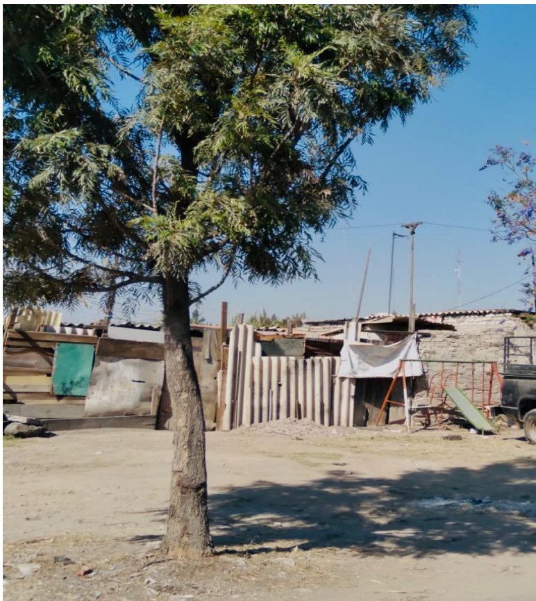
Imagen 3. Tipo de viviendas que se encuentran en "Las Casitas"

a Nezahualcóyotl y viceversa, todo a un costado de estas casitas, que se encuentran hechas de cartón con pedazos de madera o puertas de metal, es decir, en su mayoría están hechas de materiales que pudieron encontrar los habitantes, incluso telas y lonas de propaganda de los partidos políticos. A continuación, se muestran algunas imágenes de la zona de la comunidad conocida como "Las Casitas"