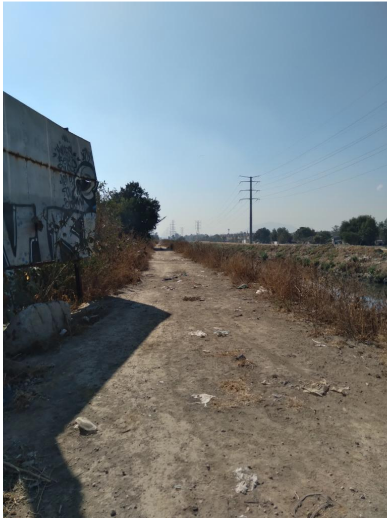
Imagen 4. Camino para llegar a “Las Casitas”