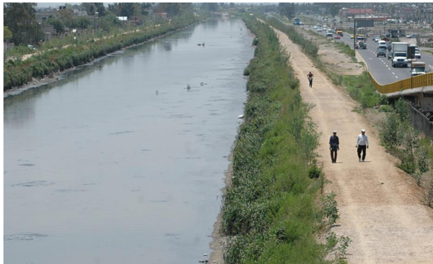
Imagen 2. Canal de la Compañía, en el Municipio de Nezahualcóyotl