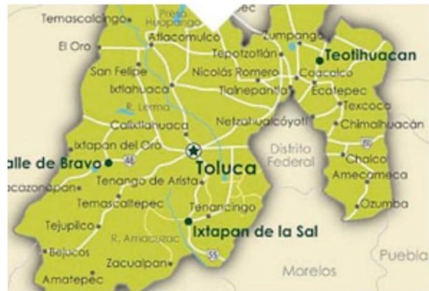
Imagen 1. Municipios Mexiquenses.