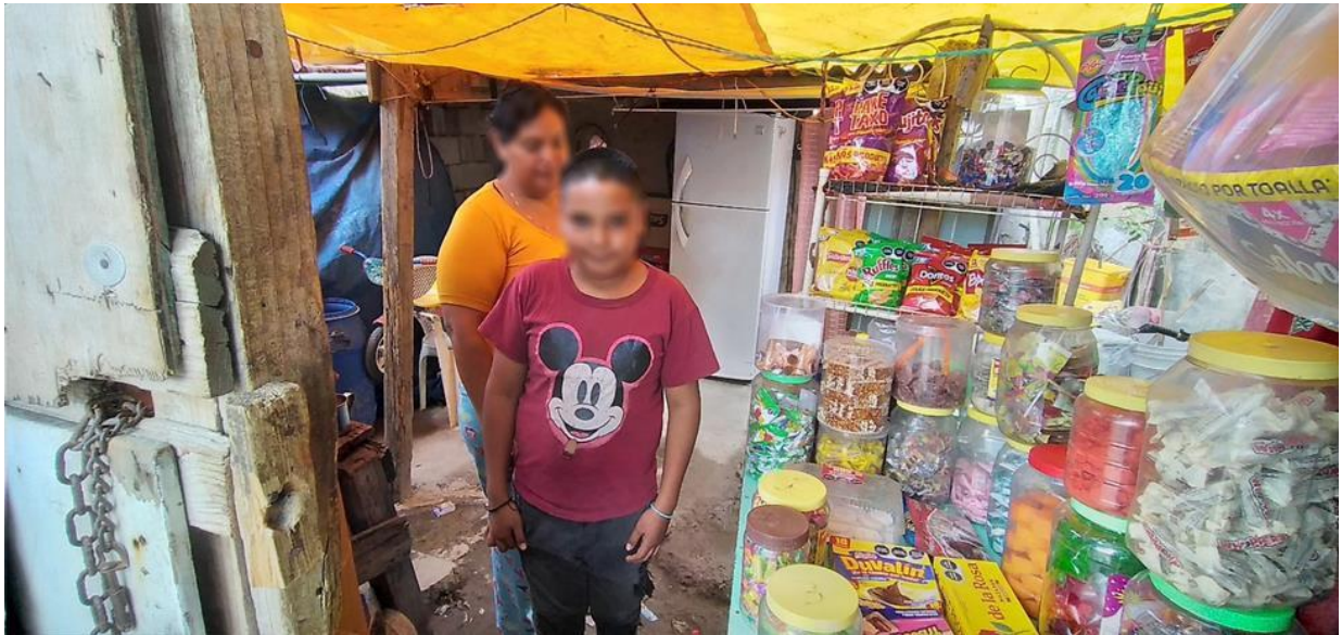
Imagen 9. Familia que participó en la quinta entrevista.

y comencé con ella, siguiendo José y al final nos dejaron retratarlos, la señora también nos indicó que si se nos ofrecía otra cosa podría regresar y ella me decía cuando porque a su esposo "no le gustan estas cosas "se le agradeció y nos despedimos.