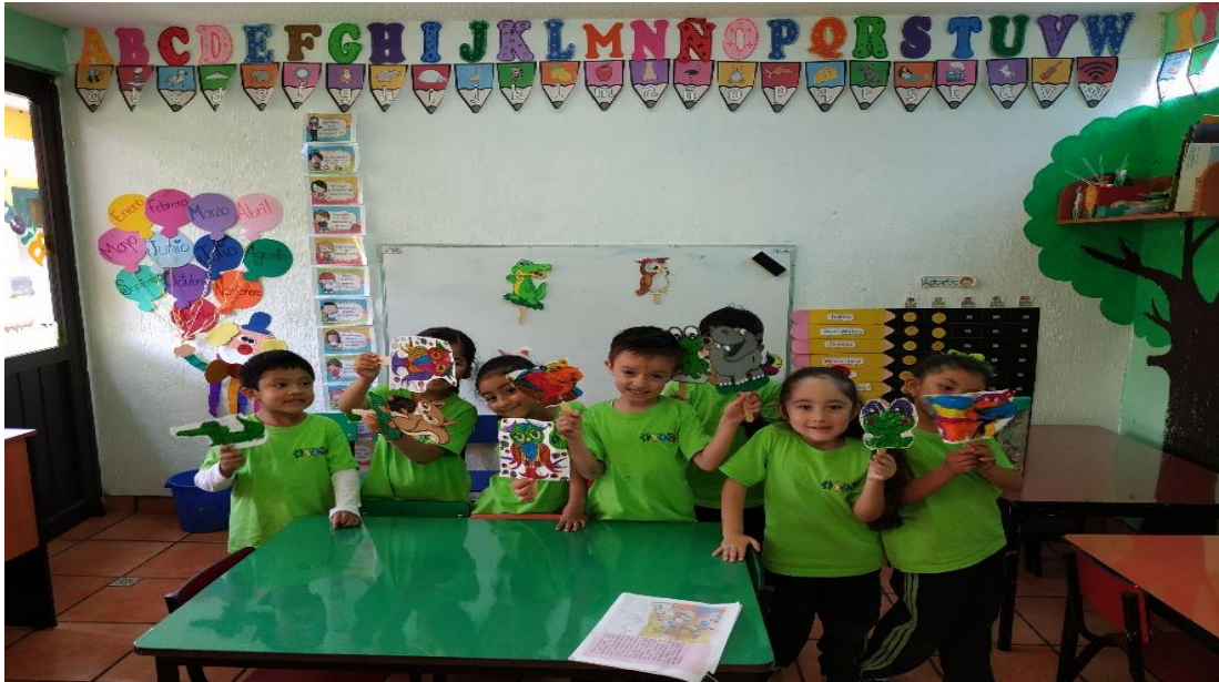
Grupo de kínder 3. Ciclo escolar 2019-2020