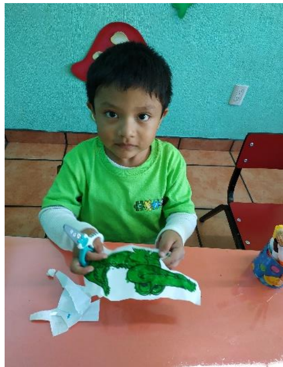
*Pintaron su personaje del