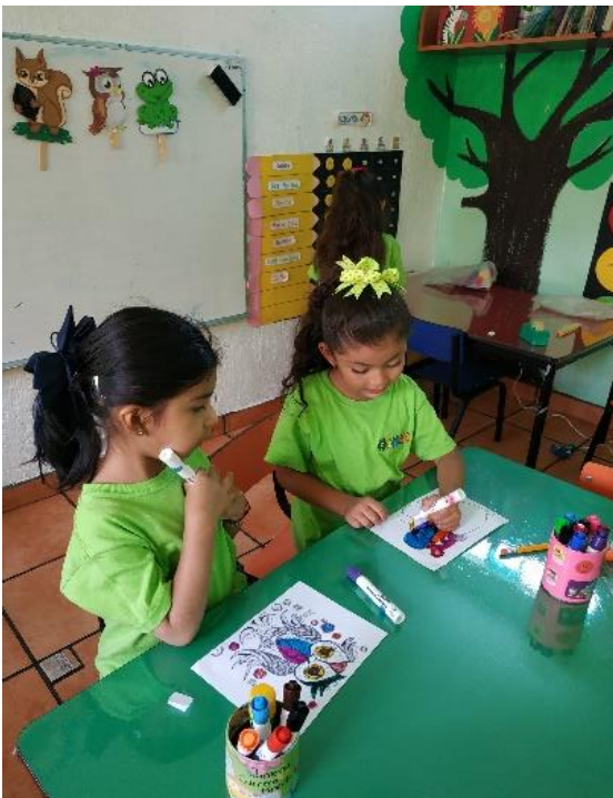
*Los educandos eligieron su personaje del cuento para participar en la obra