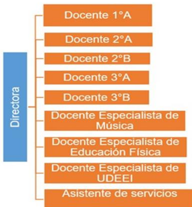
Ilustración 5. Organigrama del Jardín de Niños "Tlahuiz" 16