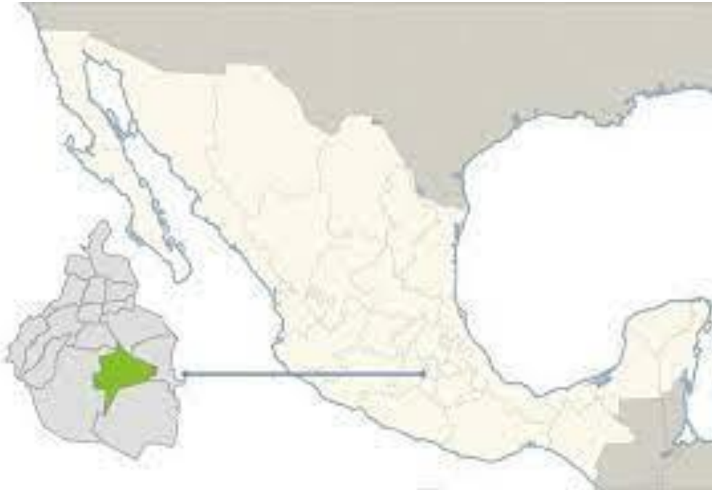
Ilustración 1 Ubicación de Xochimilco dentro de la República Mexicana 1

En el territorio de Xochimilco se encuentran 14 Pueblos originarios, así como 18 Barrios que conservan muchos rasgos de su cultura tradicional y herencia indígena, a pesar del avance de la urbanización. Además, las montañas del sur y la zona lacustre del centro forman parte de la mayor reserva natural de la Ciudad de México (CDMX). En contraste, la zona norte de Xochimilco está plenamente integrada a la mancha urbana de la CDMX, y en ella se asientan algunas zonas industriales y de servicios que constituyen parte importante de la vida económica de la Alcaldía.