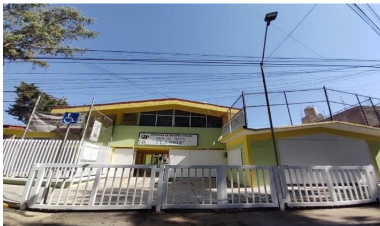
Ilustración 3 Jardín de Niños "Tlahuiz" turno vespertino 14

El plantel es de tipo exprofeso, estructurado en una sola planta baja, con antigüedad de 46 años, éste cuenta con los servicios de agua, luz, drenaje, internet, teléfono y cisterna, está delimitado por bardas de concreto.