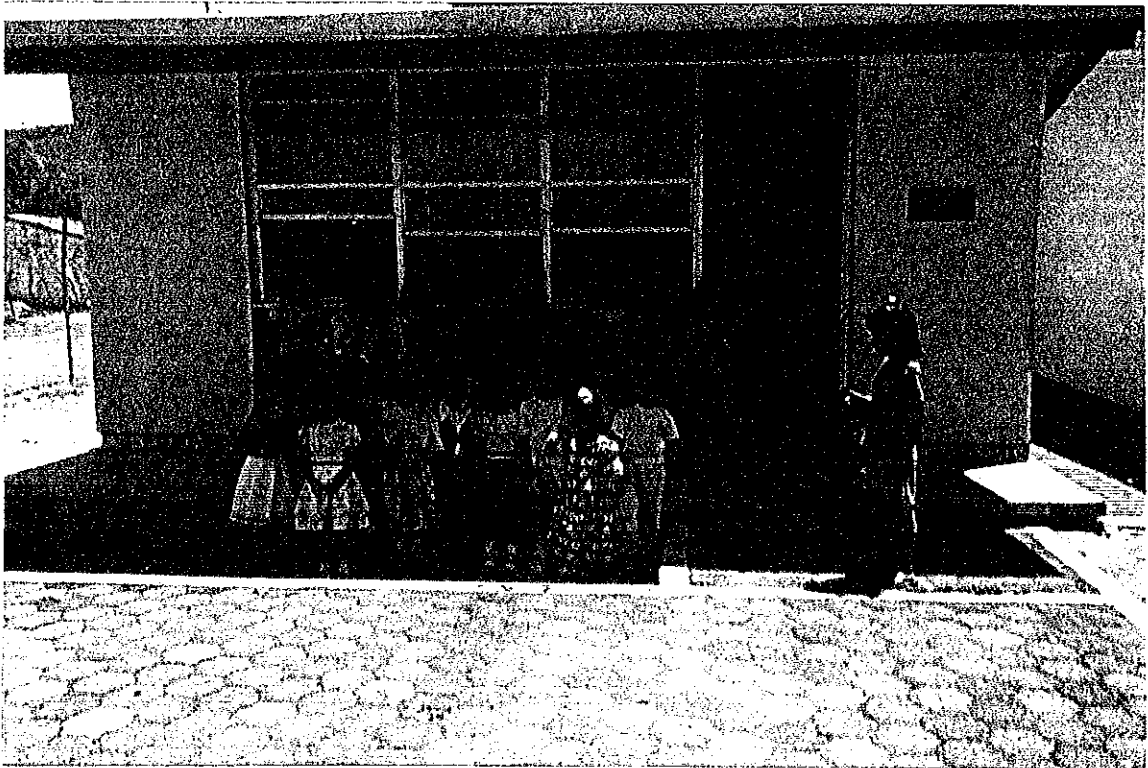
Asistencia de alguna madre de familia a realizar actividades para el programa de clausura