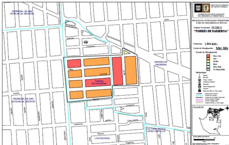
Croquis de la colonia

La escuela se encuentra dentro de una colonia de clase media, el tipo de viviendas es diverso; porque se observa desde la casa más ostentosa hasta la más humilde. La comunidad circundante la constituyen los siguientes servicios: calles pavimentadas, agua potable, energía eléctrica, teléfono e internet, teléfonos públicos y privados, televisión por cable, transporte público y gasolineras.