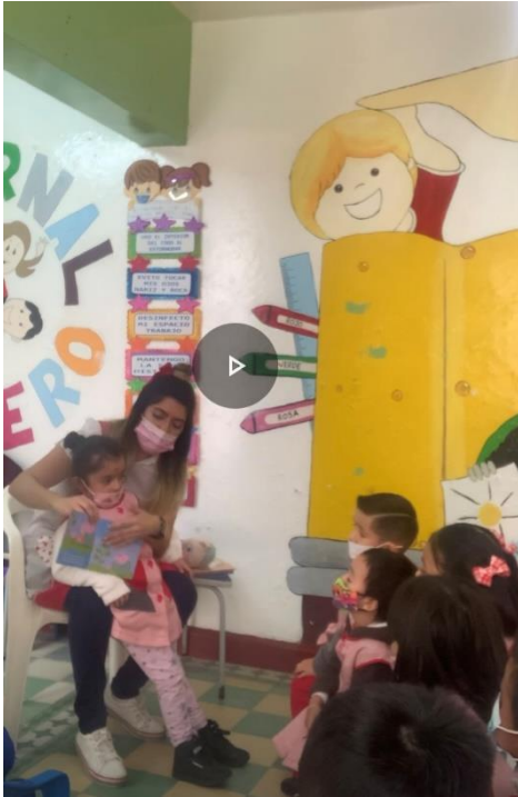
“Escuchando con atención”

“Orientaciones técnico-pedagógicas para la organización y planeación de los aprendizajes de niños con tea en el nivel preescolar dentro del aula regular”