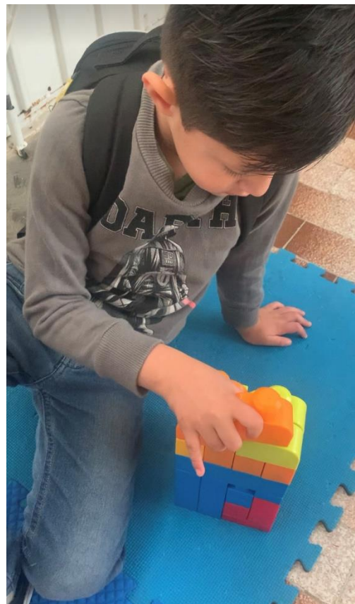
“Conociendo diversos materiales”

*En ambos casos se permite a los alumnos realizar las actividades desde su propia zona de seguridad y comodidad*