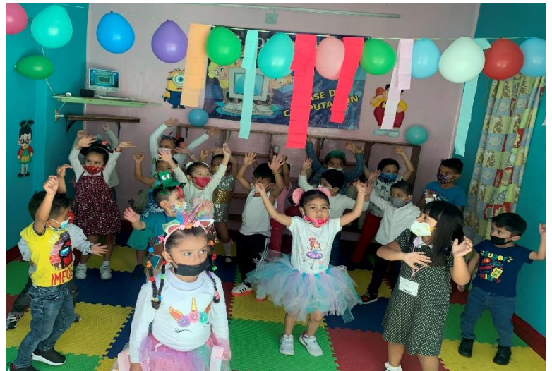
“El respeto de si mismo y los demás”

*En este tipo de actividades los espacios y consignas con claras y sugeridas por el docente*