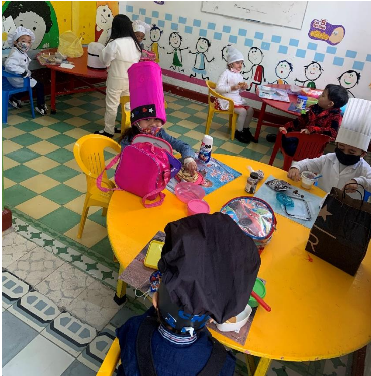
“Espero un turno”