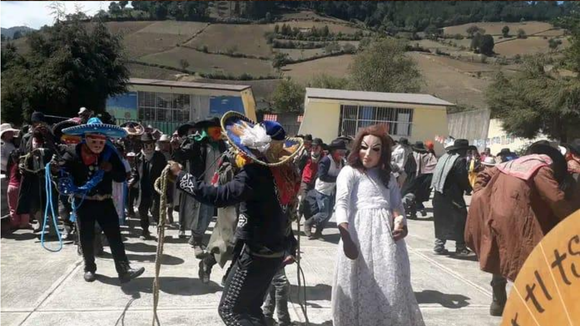
ANEXO 3 Campo de maíz labrado para sembrar