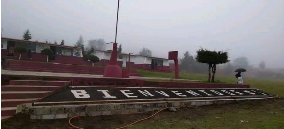
ANEXO 7-12 Foto de la escuela 1