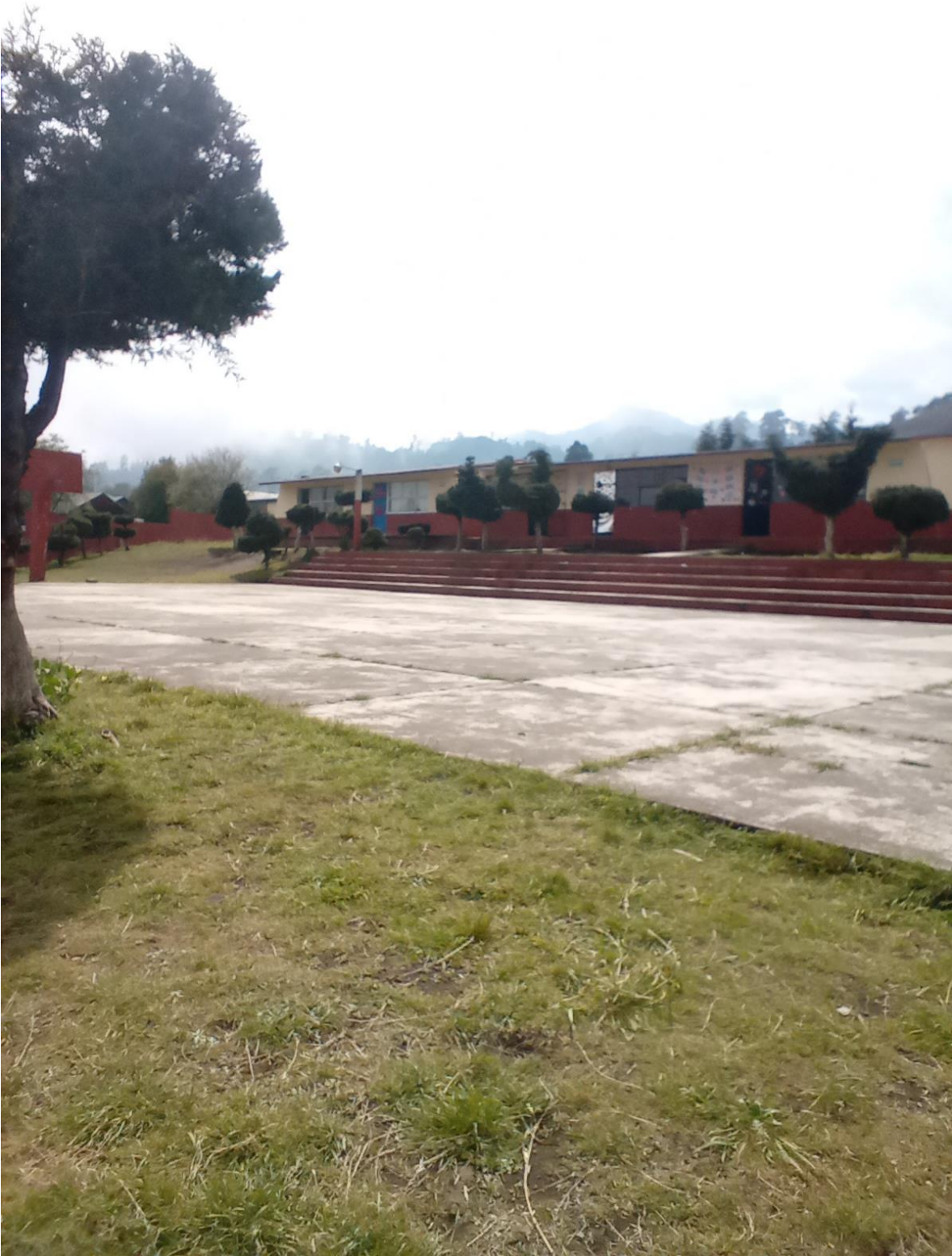
ANEXO 19 Fotografía del campo de basquetbol