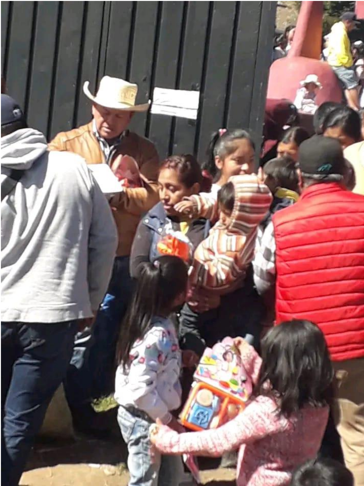
ANEXO 9-14 Foto del día de reyes donde el presidente y juez de paz participan dando jug