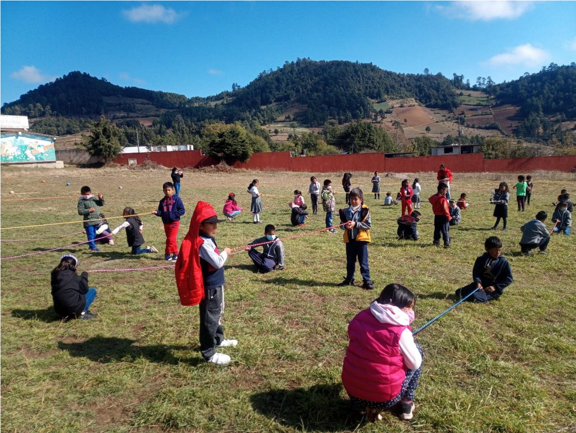
Anexo 18 Foto del campo de futbol ocupado también como practica de educación física.