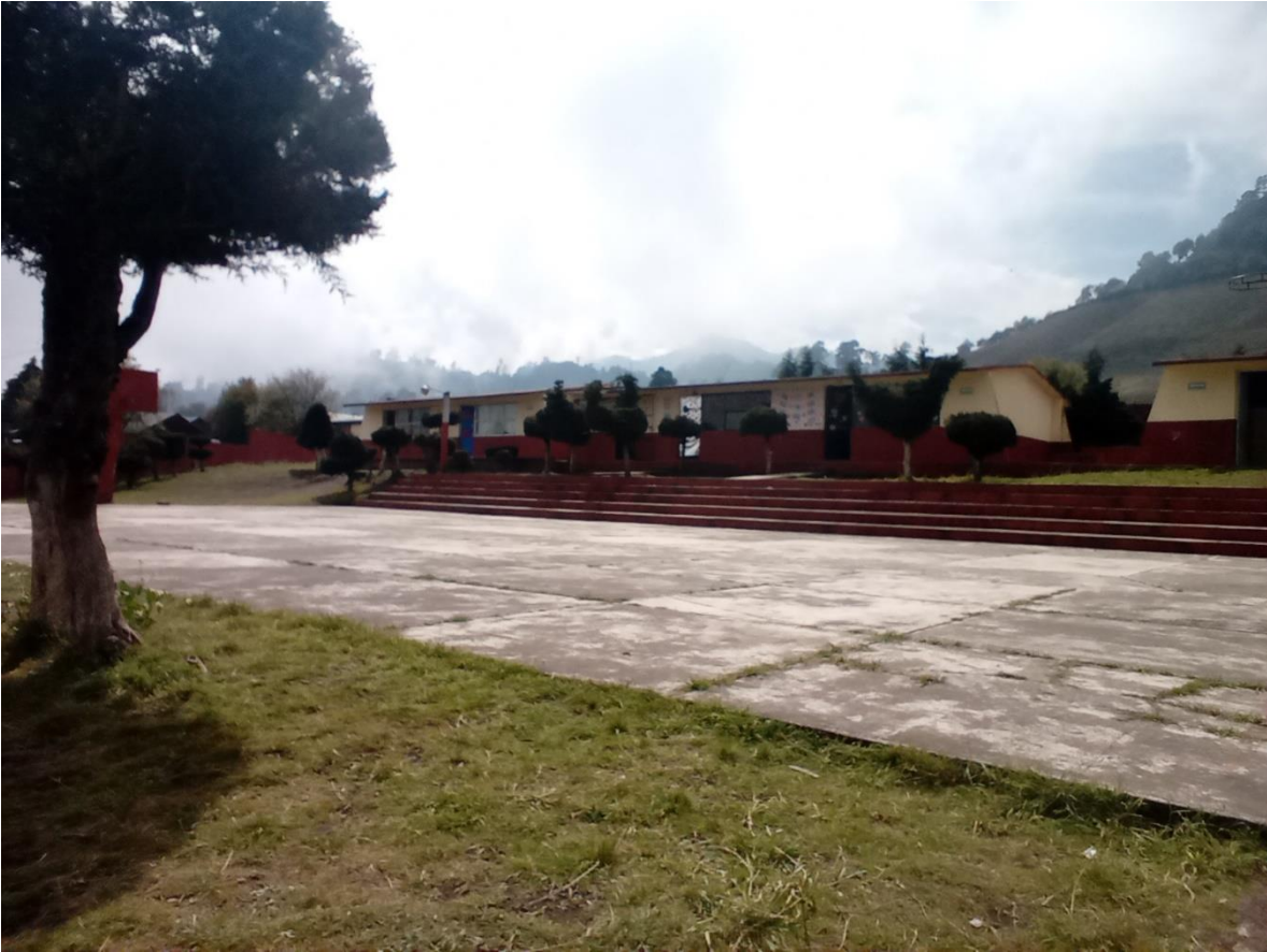
ANEXO 15 Foto de los salones de clases de la institución