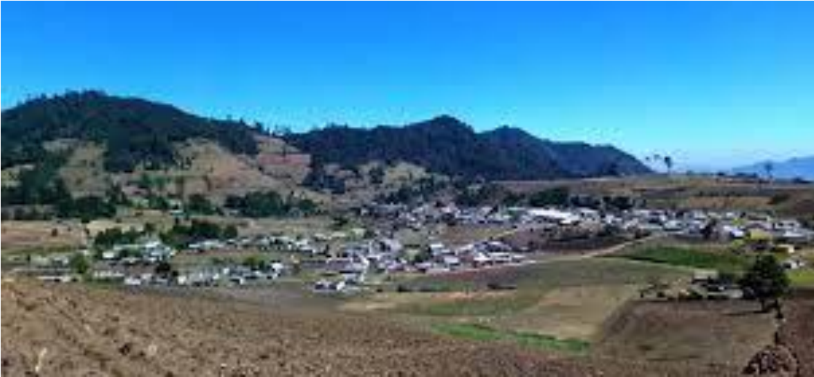
Anexo 1 (fotografía de la comunidad)