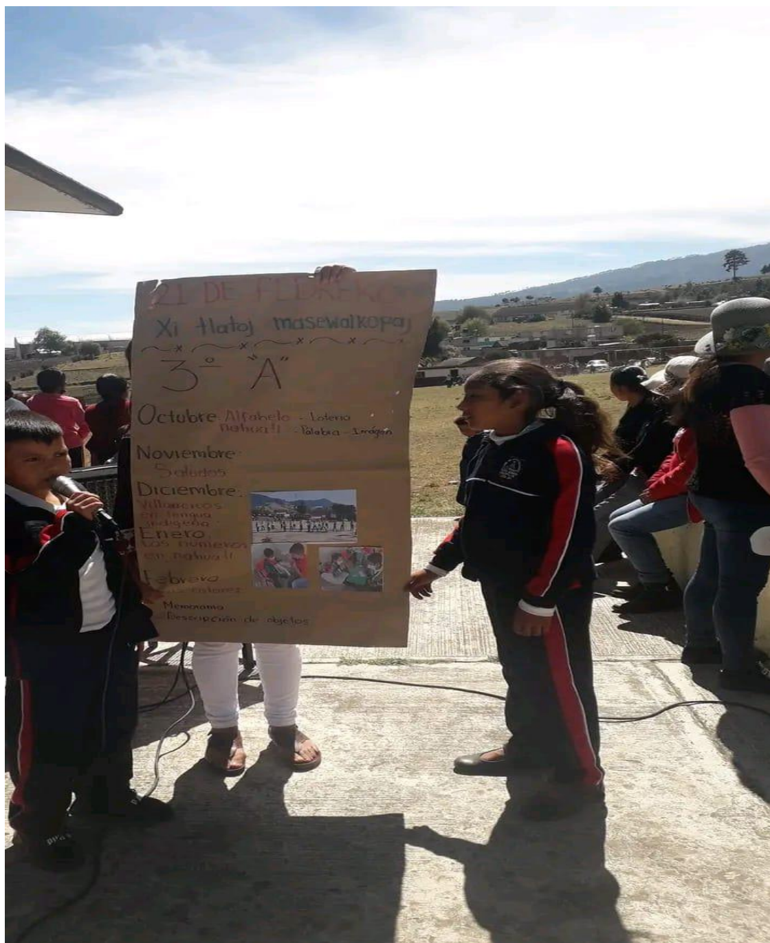
ANEXO 10 Alumnos participando en el evento de la lengua materna