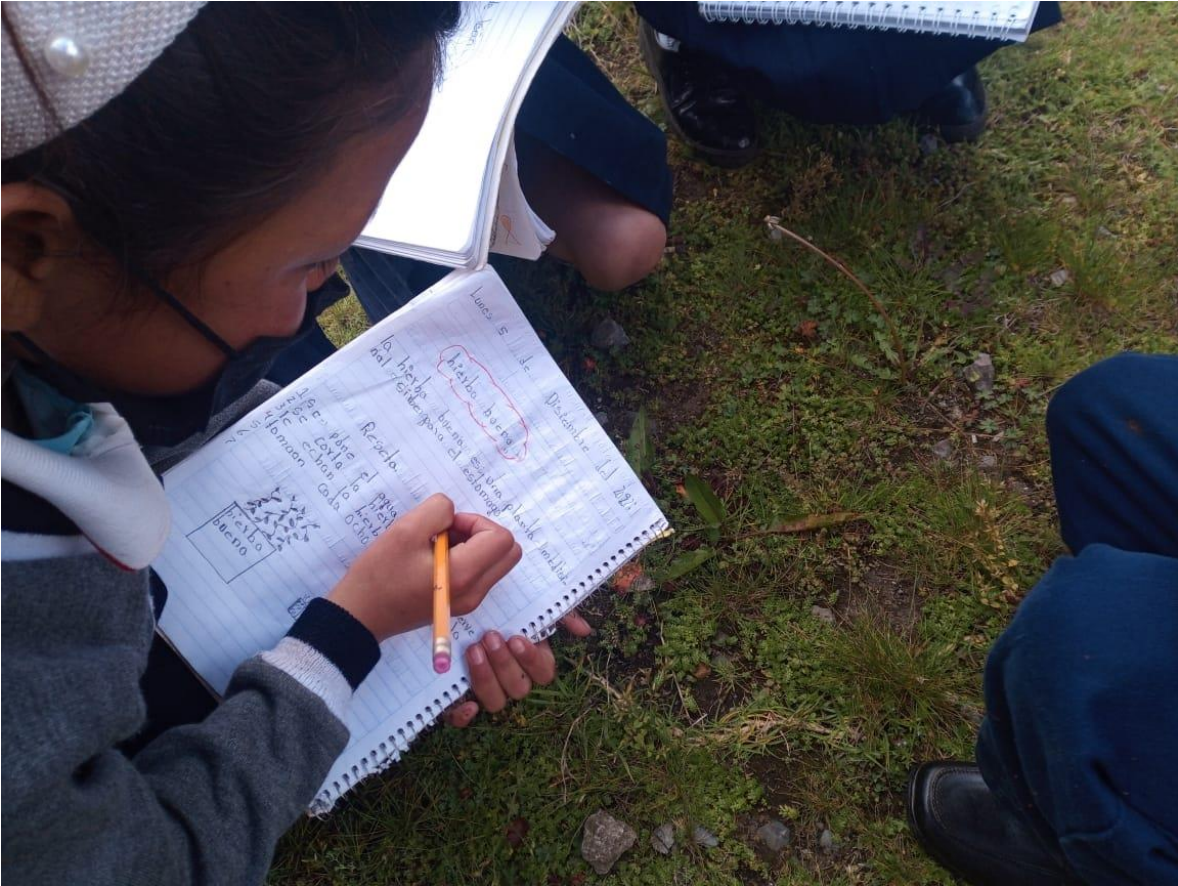
ANEXO 21 Fotografía donde el alumno esta escribiendo en una investigación en el campo