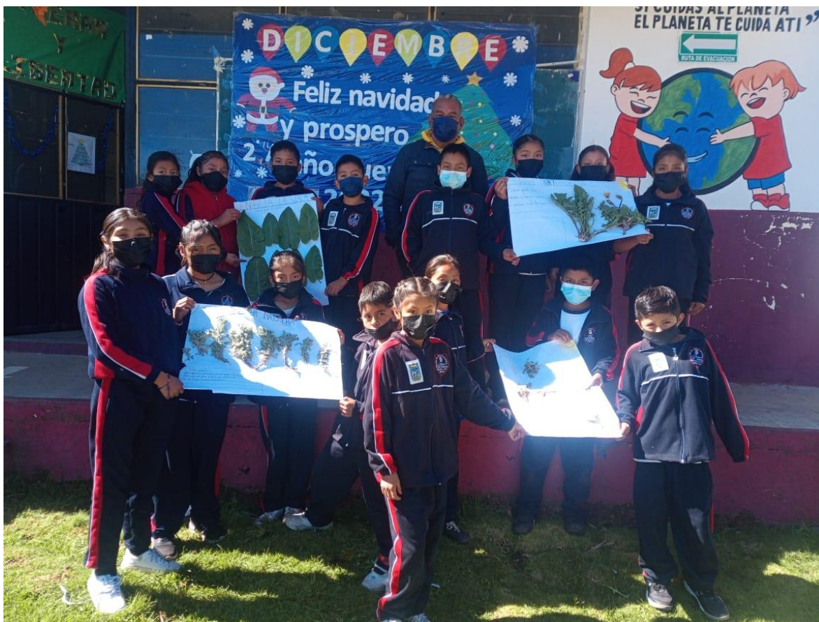
Alumnos que fueron atendidos en esta propuesta pedagógica