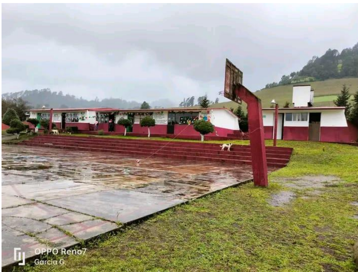
ANEXO 8 Foto de la escuela 2