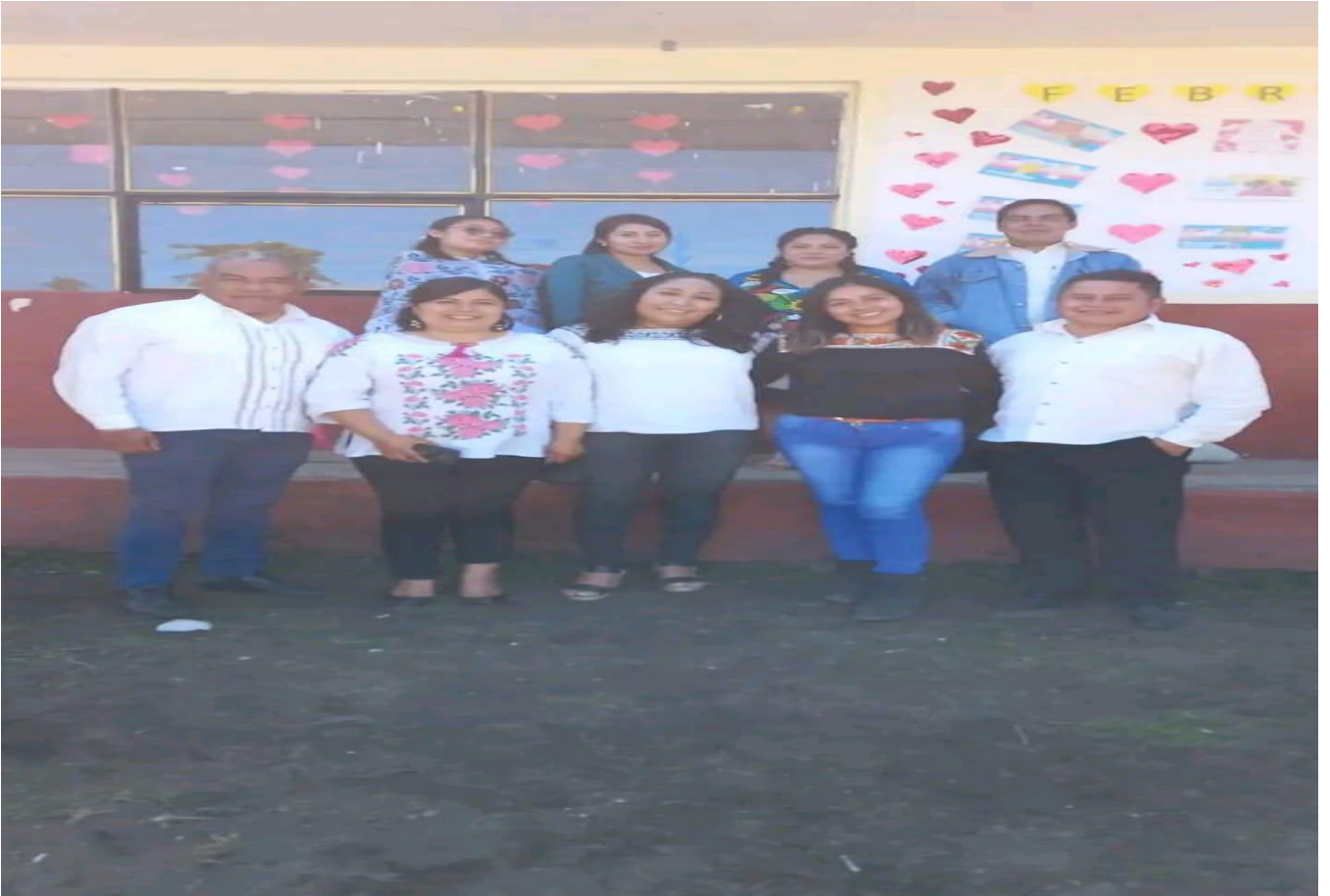
ANEXO 13 Foto del maestro que conforman la institución