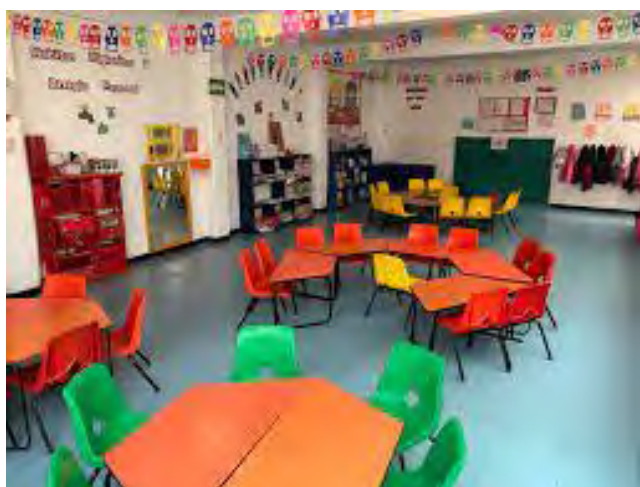
Imagen 4. Sala Maternal C 2

Actualmente me encuentro trabajando en preescolar 1, tengo 6 años de experiencia trabajando como asistente educativo, en las áreas de lactantes y maternas, es la primera vez que tengo a mi cargo a los niños preescolares, estando aquí me di cuenta de la importancia que tiene que los niños tengan actividades lúdicas, ya que es importante también para su desarrollo y aprendizaje, en mi salón cuento con 10 alumnos los cuales a través de la observación me he percatado que la falta de juegos provoca en los niños aburrimiento y falta de interés en sus actividades además de la poca participación por parte de ellos y esto perjudica mi práctica porque las actividades no se terminan, los alumnos comienzan a levantarse constantemente de su lugar, no prestan atención y por esta razón no se consiguen los aprendizajes esperados.