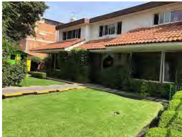
Imagen 1. Entrada del Plantel

Es un inmueble que anteriormente era una casa, fue adaptada para ser una guardería, actualmente es subrogada del IMSS, llamada Guarderías Coapa. A la entrada se encuentra el jardín para los niños.