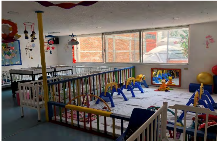
Imagen 2. Sala Lactantes "A"

En esta sala se encuentran 6 maestras: a cada una le corresponde hacerse cargo de 4 niños. Las actividades de estos niños se basan en la estimulación temprana. Dentro de la sala se encuentra el área del gateadero para esta actividad. Enseguida se encuentra la sala de Lactantes "B". Esta sala de igual manera cuenta con la capacidad para 24 niños con edad de 7 meses a 12 meses de edad. Se trabaja la estimulación temprana en el área del gateadero, su alimentación es de acuerdo a la edad de cada uno. De igual manera cuenta con un gateadero para su estimulación. Al final del pasillo se encuentra la oficina de nuestra representante legal. En el pasillo que sigue se encuentra la sala de Lactantes "C", en esta sala los niños tienen la edad de 13 meses a 19 meses. Aquí, la mayoría de los niños ya caminan.