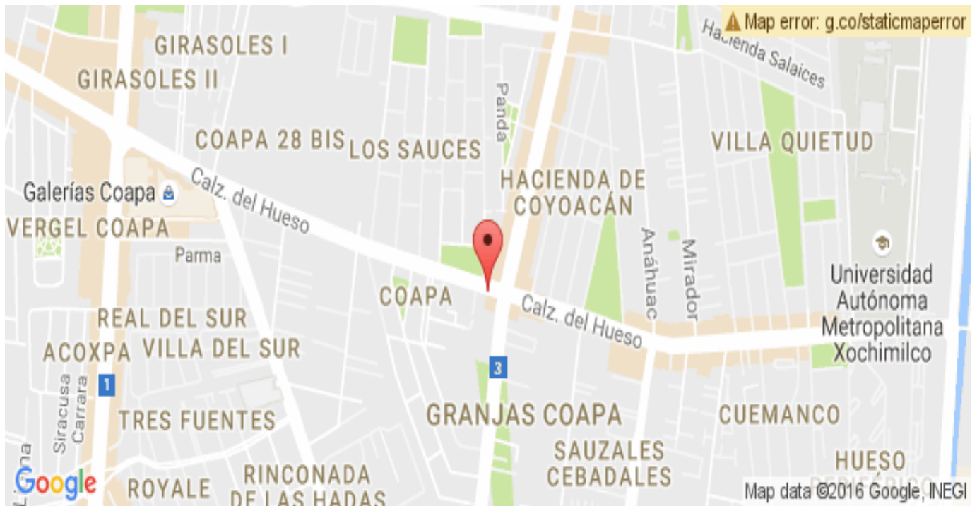
Imagen 5. Guarderías Coapa. Ubicación

La institución cuenta con la directora que en algunas ocasiones su trato hacia el personal no es muy cordial y esto provoca que a veces el clima laboral se haga pesado, de igual manera no permite que nosotras seamos las que entreguemos a los niños y de esta manera tener un poco más de comunicación con los padres de familia, una educadora que se encarga de llevar a cabo la revisión de los planes de trabajo, sin embargo a las maestras de preescolar no siempre nos revisa los planes como debe ser y, por lo tanto no sabemos si los estamos trabajando como debe ser, una coordinadora de pedagogía que supervisa toda el área asistencial de los niños, de igual manera cuando hay alguna falta de personal, nos manda a cubrir los descansos para que se cubra esa sala y no se queden solas las maestras esto provoca que las actividades se lleven a cabo en tiempo y forma con los alumnos y no se alcancen los aprendizajes esperados. Una nutrióloga que es encargada de la alimentación de los niños sea de acuerdo con su edad cinco personas en la cocina y un vigilante. Todo el personal tiene un horario laboral de 7:00am a 4:00pm.