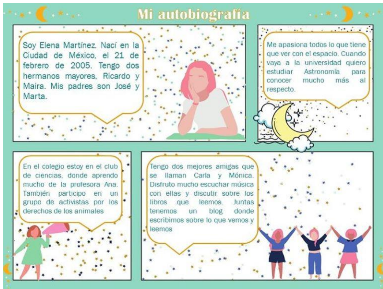
Imagen 4. Ejemplo 3 de Autobiografía.