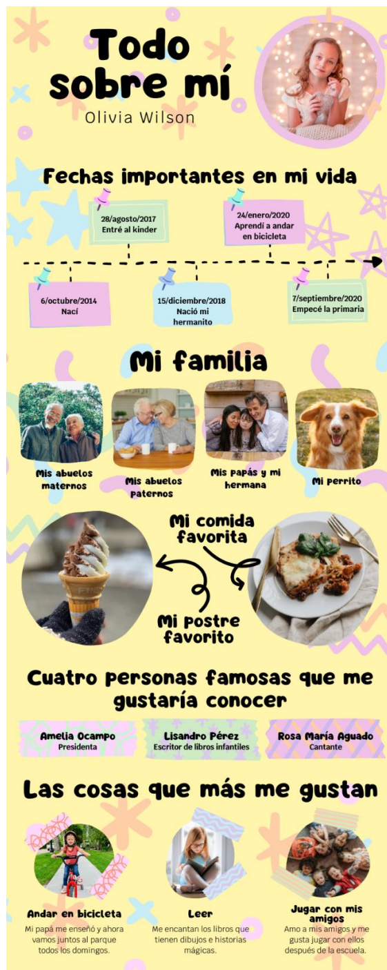
Imagen 3. Ejemplo 2 de Autobiografía.