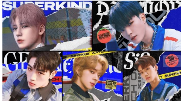
Figura 4. Concepto de la Banda Superkind

como parte de algún mundo virtual, pero se hacía la diferencia entre los ídolos humanos y el único ídolo virtual.