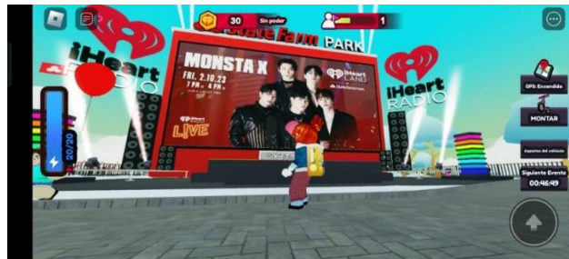
Figura 3. Concierto del grupo “Monsta X” en la plataforma de Roblox.

Jon Vlassopoulos (2020) el encargado de la música de Roblox mencionó para The Verge que el objetivo es que a largo plazo puedan hacer mejores experiencias virtuales incluso mejores que las experiencias del mundo real.