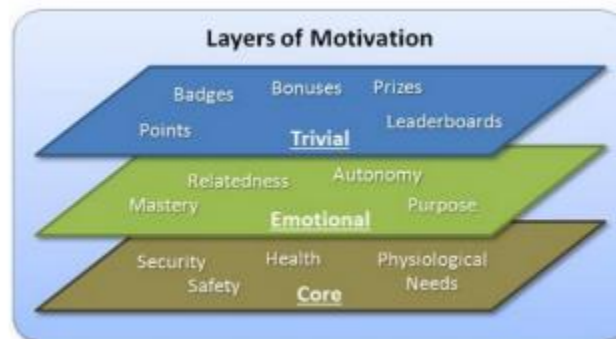
Figura 7: Capas de motivación.

Es importante recalcar que existen tres capas de motivación de menos concreto (inferior) a más concreto, tal y como muestra la figura 2. Las dos primeras capas se refieren más a necesidades (emocional) y relacionadas también con el estado del individuo (núcleo) la última capa (trivial) se refiere a elementos concretos.