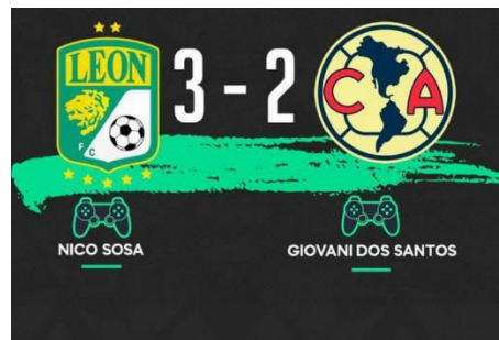
Figura 1. Promocional de la E- Liga BBVA MX

Yo me pregunto ¿Por qué si ellos pudieron adaptarse, por qué la educación no puede?