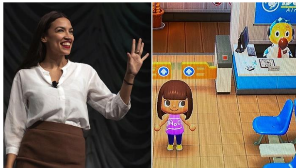
Figura 2. Alejandría Ocasio-Cortez y su avatar dentro del juego animal Crossing

Siguiendo esta misma línea organizaciones como NextGen América modificaron entornos en Animal Crossing para conectar el apoyo, Alejandría Ocasio-Cortez congresista por Nueva York creó su propia cabaña dentro del juego para atraer seguidores y poder interactuar con ellos en un medio virtual.