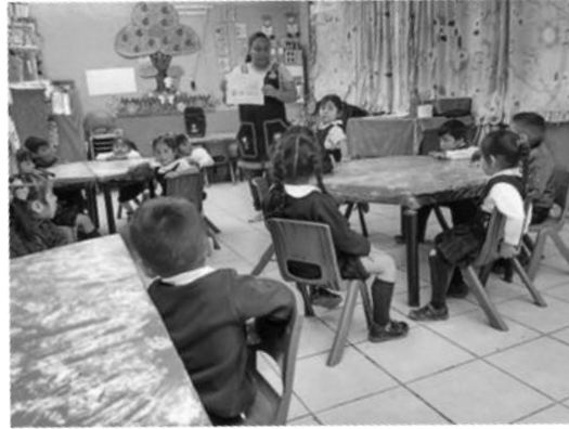
Figura 1. Alumnos grupo 1° A

En la Figura 1. Se aprecia los alumnos del grupo 1° A del Jardín de Niños Gabriela Mistral, Montecillo, Estado de México.