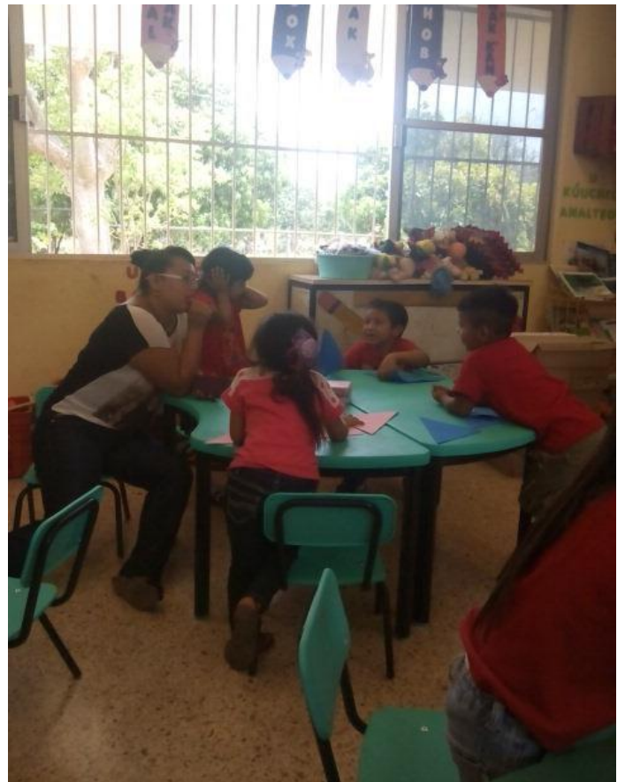
Anexo 4. Alumnos y alumnas realizando su actividad de las figuras geométricas