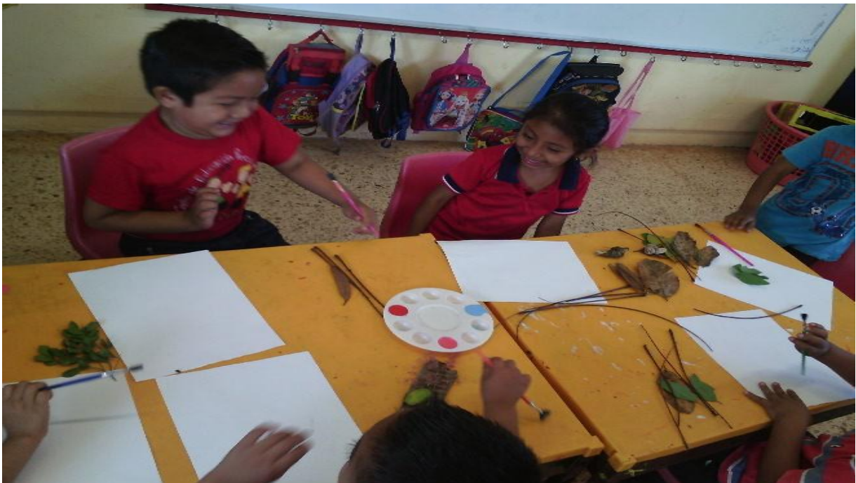
Anexo 1. Alumnos y alumnas realizando la actividad la naturaleza imprime