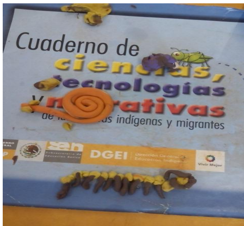
Anexo 3. Realizando actividad de juegos cuentos y cantos con los alumnos y alumna