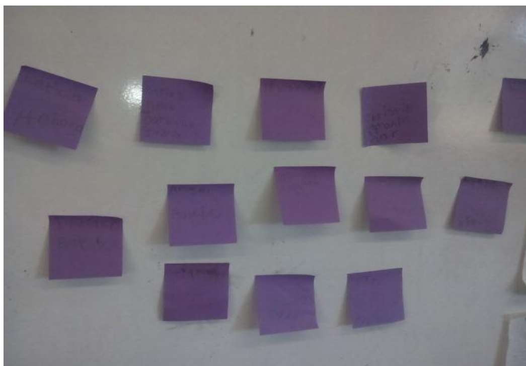
Anexo 8. En la realización de formar palabras con las vocales