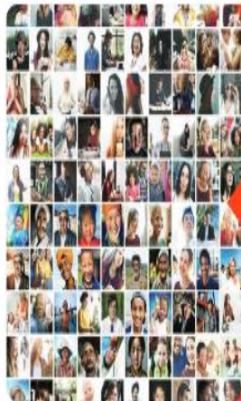
TABLA DE CONTENIDOS DEL LIBRO DE TEXTO EDITORIAL NORMA