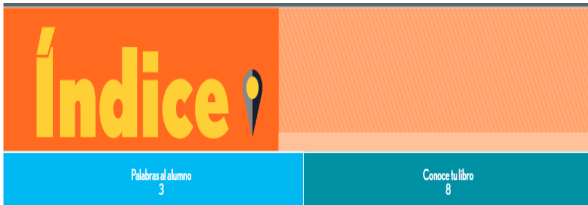
TABLA DE CONTENIDOS DEL LIBRO DE TEXTO EDITORIAL NORMA