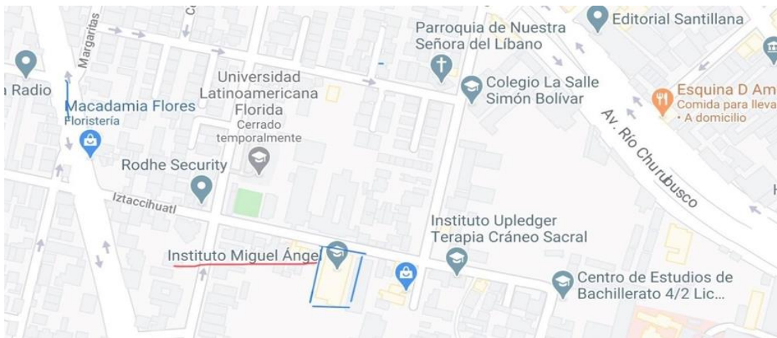
Mapa de la ubicación 22

El “Instituto Miguel Ángel se encuentra ubicado en la calle de Iztaccíhuatl 239 colonia Florida en la Ciudad de México, en la Alcaldía Álvaro Obregón entre las calles de Manzano y Moras. La población del Instituto que asiste es de la misma colonia, y de algunas otras cercanas como Crédito Constructor, San José Insurgentes, San Ángel Inn, otras Alcaldías como Benito Juárez y Coyoacán. 21