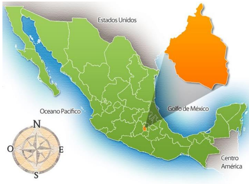
Imagen - República Mexicana 2

La Alcaldía Álvaro Obregón en la Ciudad de México pertenece a una de las 16 Alcaldías que pertenecen a la Ciudad.