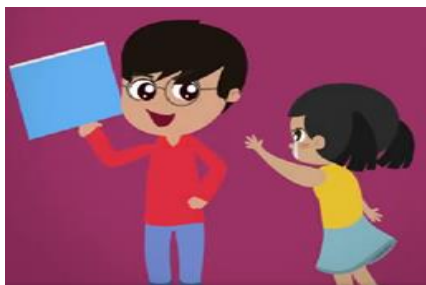
Imagen 3. Son más fuertes que sus víctimas. (SEP, 2018)

Debe señalarse que, así como en la víctima se presentan indicios, también en el acosador se pueden observar ciertos indicios que estos presentan ante los cuales se debe tener el conocimiento para estar alerta, es bien sabido que en la mayoría de las veces el acosador es más